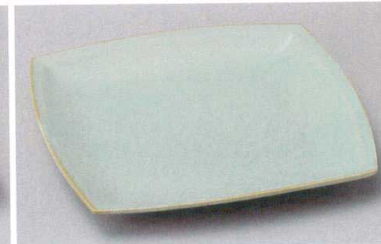
36610-321 グリーン窯変マット13cm角皿 920円 (13×12.8×1.9cm) 36611-321 グリーン窯変マット18cm角皿 1,840円 (18×17.8×2.3cm) 36612-321 グリーン窯変マット22cm角皿 2,600円 (22.2×22×2.7cm)