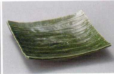
36603-051 そぎ織部正角8.0皿 2,980円 (22×22cm)