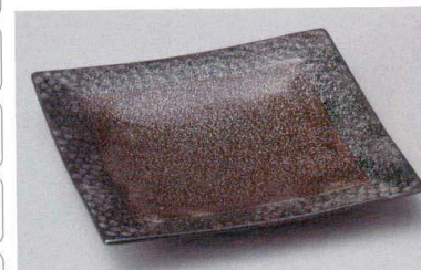
36609-051 茶色ショコ正角7.0皿 2,600円 (21.5×21.5×2cm)