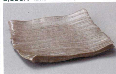
36605-481 雪志野8.0正角皿 3,000円 (24×24×3.2cm)