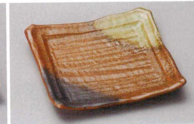
36619-471 南蛮織部吹き正角皿 2,450円 (21.5×21.5×3.5cm)