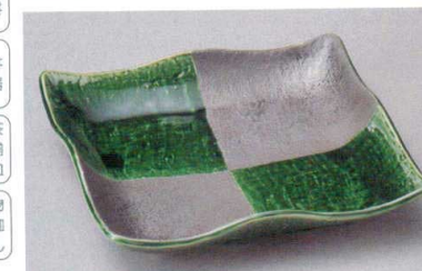
36623-181 織部市松正角和皿 1,280円 (18×18×3.2cm) 36624-181 織部市松9.0正角皿 2,300円 (23.3×23.3×4.5cm)