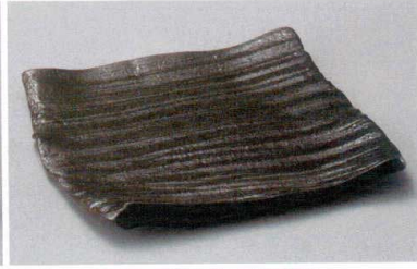
36604-48-711 黒いぶし8.0正角皿 3,000円 (24×24×3.2cm)