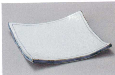
36601-151 洩筋5.0正角皿 1,950円 (15.5×15.5×1.5cm) 36602-151 洩筋7.0正角皿 3,650円 (20.5×20.5×3cm)