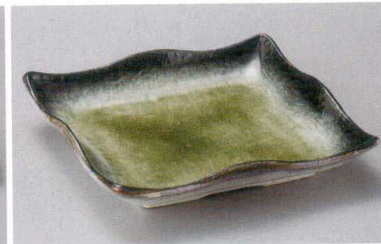
36606-031 均窯織部9.0正角皿 2,700円 (23.4×23.4×4.4cm)