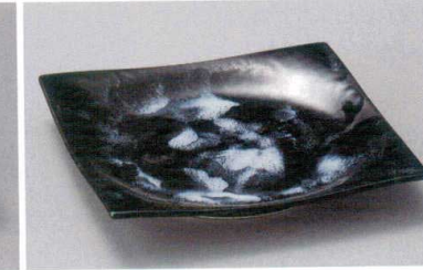
36627-161 浮雲4.5正角皿 520円 (13.6×13.6×2.4cm) 36628-161 浮雲5.5正角皿 850円 (17.3×17.3×2.8cm) 36629-161 浮雲7.5正角皿 2,280円 (23.2×23.2×4cm)