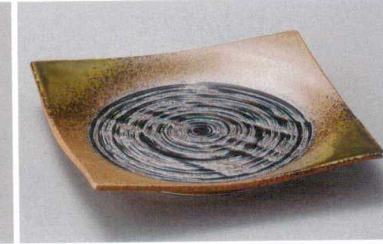
36620-281 美濃古道手引き4.5正角皿 550円 (13.6×13.6×2.8cm) 36621-281 美濃古道手引き5.5正角皿 970円 (17.3×17.3×3cm) 36622-281 美濃古道手引き7.5正角皿 2,400円 (23.5×23.5×4cm)