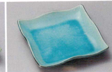
36625-541 スカイブルー正角皿(小) 1,400円 (18.5×18.5cm) 36626-541 スカイブルー正角皿(大) 2,400円 (24×24cm)