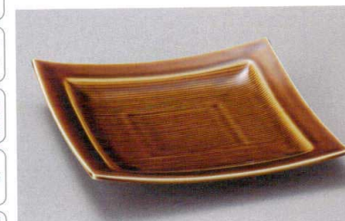
36616-301 ヴァーグアメ15cm千段正角皿 1,200円 (15×2.5cm) 36617-301 ヴァーグアメ19cm千段正角皿 1,850円 (19×2cm) 36618-301 ヴァーグアメ21cm千段正角皿 2,450円 (21×2.3cm)