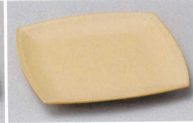
36613-321 イエロ-窯変マット13cm角皿 920円 (13×12.8×1.9cm) 36614-321 イエロ-窯変マット18cm角皿 1,840円 (18×17.8×2.3cm) 36615-321 イエロ-窯変マット22cm角皿 2,600円 (22.2×22×2.7cm)