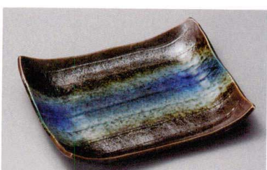
36709-541 黒青吹そぎ長角盛皿 2,200円 (26×21×3cm)