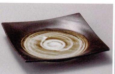
36715-231 深山雪手引正角4.5皿 600円 (14×14×2.8cm)