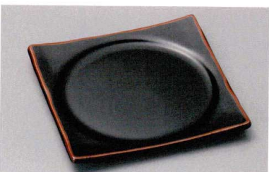
36708-021 ゆず天目正角盛皿 2,200円 (20.8×20.8×2.3cm)