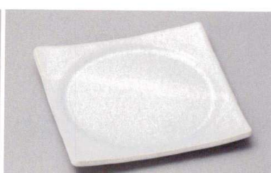
36706-021 粉引白正角盛皿 2,200円 (20.8×20.8×2.3cm)