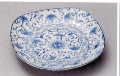
36714-541 藍彩四角7.5皿 1,400円 (21×21×4cm)