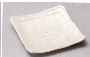
36703-471 粉引きそぎ正角皿 2,250円 (21.5×21.5×3.5cm)