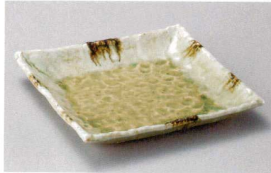
36701-481 砂ビードロ8.0正角皿 2,800円 (24×24×4cm)