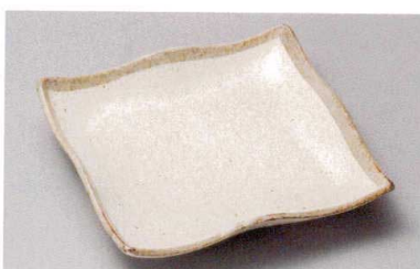
36705-631 白唐津9.0正角皿 2,250円 (23.5×23.5×4.2cm)