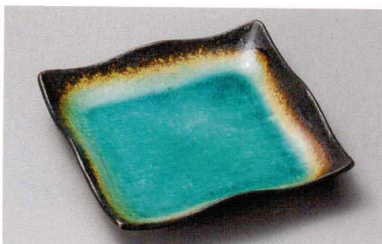
36704-631 緑彩9.0正角皿 2,250円 (23.5×23.5×4.2cm)