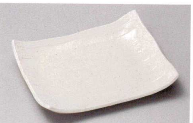
36710-541 白釉そぎ長角盛皿 2,200円 (26×21×3cm)