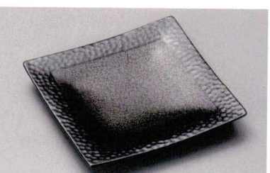
36711-461 ショコラ楕目形正角皿 2,150円 (21.5×21.5×2cm)