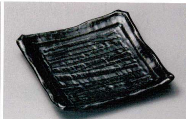
36702-471 ブルーそぎ正角皿 2,250円 (21.5×21.5×3.5cm)