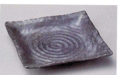
36712-181 銀鱗手造り6寸正角皿 1,050円 (17.2×17.2×3.2cm)