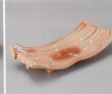
37612-011 焼ポタモチ11.0長皿 7,140円 (34.5×15.5×8cm)