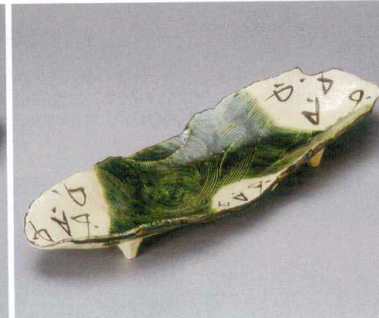
37608-531 織部くし目長皿 9,400円 (44.5×15×5cm)