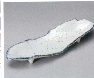
37607-461 かいらぎクシメ舟形盛皿 10,400円 (43×15×5.5cm)