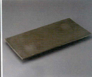
37606-161 炭化土木目尺7足付盛込皿 15,300円 (52×25.5×3cm)