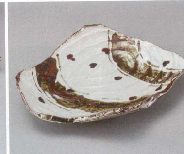
37611-01-521 鎗絵辰砂渦彫11.0盛込皿 8,100円 (35×27×6.5cm)