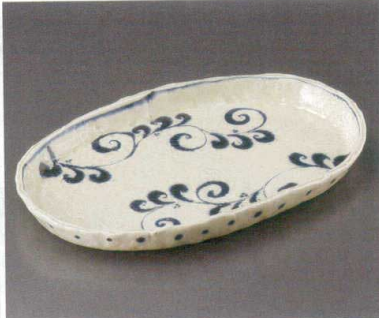
37602-181 安南花紋楕円大盛皿(手造り) 14,500円 (40×25.5×3.5cm)