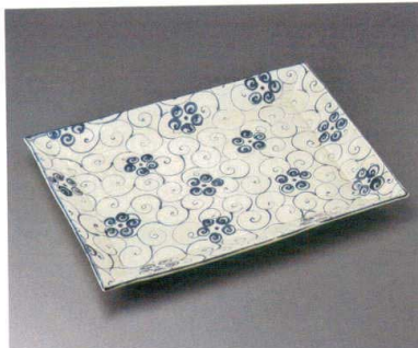
37601-181 安南花唐草特大長角パーティー皿(手造り) 48,000円 (51×38.5×4.5cm)