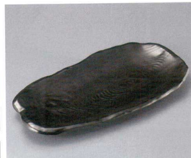
37604-411 黒マット木目尺5大皿 25,000円 (45.5×24×3cm)