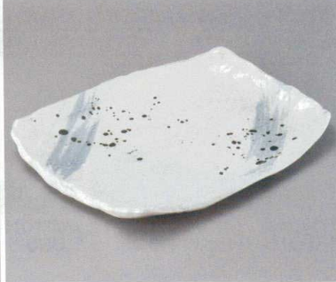
37603-281 涼風台形大皿 12,400円 (36.5×29.7×4.3cm)