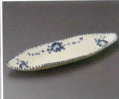
37605-181 安南花紋舟形大盛皿(手造り) 16,250円 (57×17×5cm)