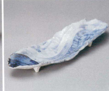
37609-471 呉須串目長皿 9,500円 (43×14.5×6cm)