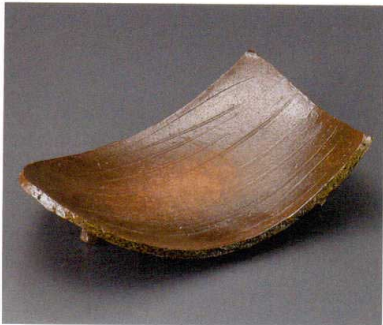
37704-181 備前風枯木形足付盛込皿 13,600円 (34.5×22×5.7cm)