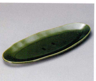
37712-461 オリベ16.0小判盛皿 13,900円 (49.5×20×3cm)