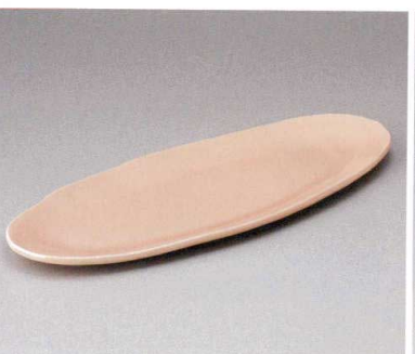
37711-461 ピンク貫入16.0小判盛皿 13,900円 (49.5×20×3cm)