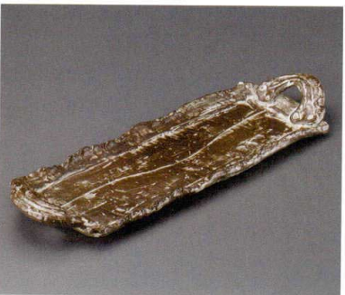
37707-071 炭化土白化粧尺5寸皿 8,000円 (46×16×5cm)