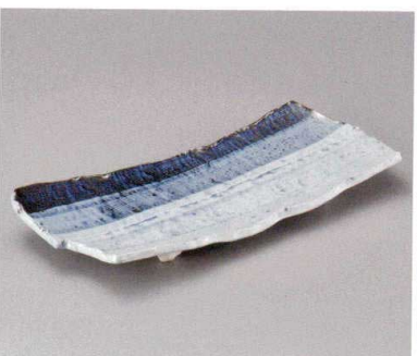
37708-081 呉須線段尺二皿 6,300円 (38×16×3.5cm)