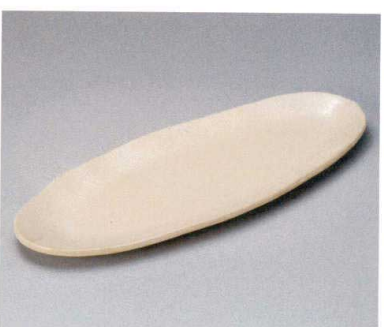
37709-461 ホワイト16.0小判盛皿 13,900円 (49.5×20×3cm)