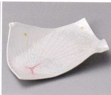
37702-011 ピンクー珍ラスター8.5折紙皿 6,120円 (26.5×19.3×8.5cm)