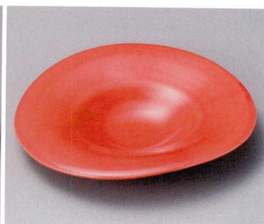
37703-081 赤釉ハット型盛鉢 6,500円 (25.6×24.2×4.6cm)