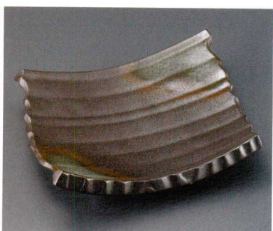
37706-301 備前瓦皿(大) 7,300円 (42×33×7cm)