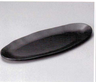
37710-461 ブラックマット16.0小判盛皿 13,900円 (49.5×20×3cm)