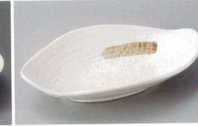
38624-111 白ハケ目変形盛り鉢 1,980円 (28.3×17.6×5cm)