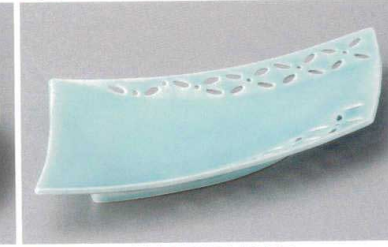
38610-181 湖水菱紋透し前菜皿 3,550円 (26×15.5×3.3cm)