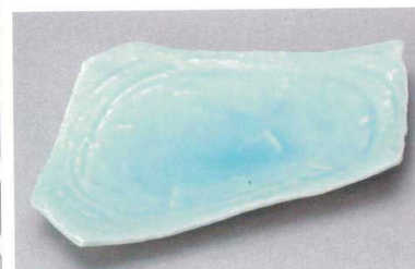
38608-471 湖水青磁変形皿 3,000円 (29.5×18.5×3.2cm)