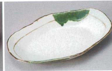
38605-451 織部流し小判多用皿 3,140円 (27.5×17.9×3.5cm)