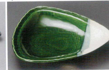
38621-641 織部塗分三角皿(小) 900円 (15×15×3cm) 38622-641 織部塗分三角皿(中) 1,800円 (23×23×3.8cm) 38623-641 織部塗分三角皿(大) 2,400円 (26×26×5cm)