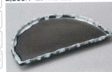
38618-311 融雪半月皿(小) 1,470円 (21×10×2.2cm) 38619-311 融雪半月皿(中) 2,270円 (23×13.2×2.4cm) 38620-311 融雪半月皿(大) 2,540円 (26×15.5×2.6cm)