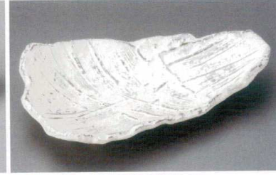
38603-521 粉引拭取り変形9.0皿 3,700円 (27×16.5×5cm)