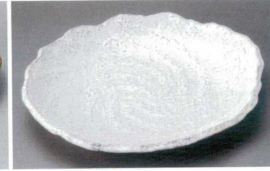
38606-711 白うず8号皿 2,100円 (24.5×21.5×3.5cm) 38607-711 白うず10号皿 3,300円 (30.5×26.5×3.8cm)