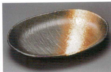
38604-461 いぶし備前9.0楕円皿 3,300円 (27×20×3.5cm)