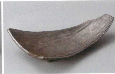
38602-101 金結晶9.5寸三角皿 3,800円 (27×16×5.2cm)