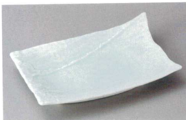
38601-221 青白磁しぶき盛皿 3,450円 (27.5×19.2×5.5cm)