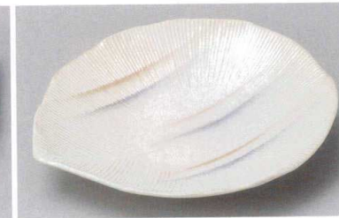
38609-251 さざなみ葉形8.0皿 2,920円 (25.2×23×4.7cm)