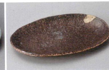
38613-321 南蛮金銀小判プラター(中) 1,650円 (18.8×13.7×2cm) 38614-321 南蛮金銀小判プラター(大) 2,900円 (28.2×18.3×2.3cm)