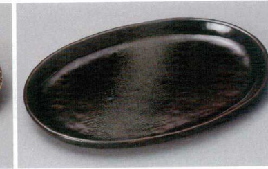
38615-461 備前灰釉6.0小判皿 1,430円 (17.5×12×2.5cm) 38616-461 備前灰釉7.0小判皿 2,050円 (22.5×15×1.5cm) 38617-461 備前灰釉8.5小判皿 2,600円 (26×17.5×2cm)