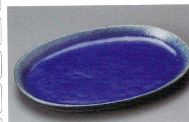
38611-461 海碧7.0小判皿 2,150円 (22.5×15×1.5cm) 38612-461 海碧8.5小判皿 2,800円 (26×17.5×2cm)