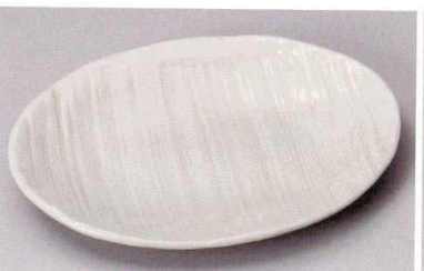
38913-461 古染青磁貫入(クシメ)8.0楕円皿 3,900円 (25×19×3cm)