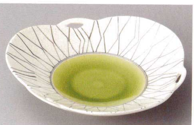
38910-121 手描グリーン釉前菜皿 4,000円 (20×20×4.3cm)