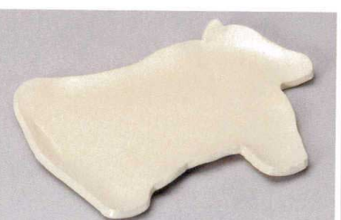
38914-621 牛 黒焼肉皿(小) 3,900円 (20×14×1.8cm) 38915-621 牛 白焼肉皿(小) 3,900円 (20×14×1.8cm)