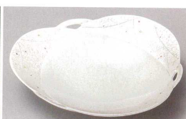
38906-121 ラスターブチドット前菜皿 4,200円 (20×20×4.2cm)