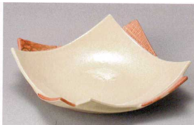
38902-451 赤絵重ね皿(大) 4,360円 (21×21×5.8cm)