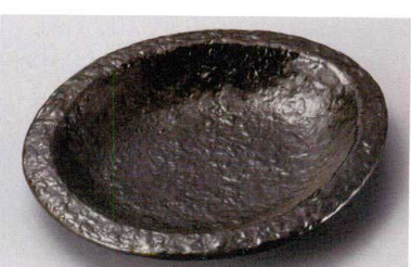
38912-221 黒釉帽子型7.0皿 3,900円 (23×20.5×3.5cm)