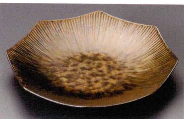
38908-471 金結晶しのぎ彫八角8.0鉢 4,100円 (25×4cm)