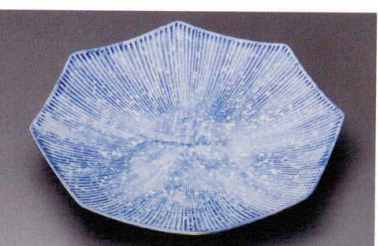
38911-541 インディコブルーしのぎ彫八角8.0皿 4,200円 (24.3×24×3.8cm)