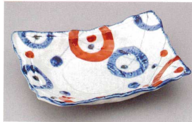
38901-141 まど花 長角盛鉢 4,400円 (20.5×15.5×5.5cm)