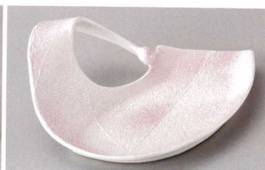
38903-181 銀彩アーチ型前菜皿 5,100円 (20×17×6.5cm)