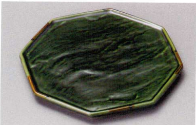
38907-471 織部八角前菜皿 4,150円 (23×21.5×2cm)