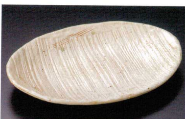
38905-461 白唐津(クシメ)8.0楕円皿 4,200円 (25×19×3.5cm)