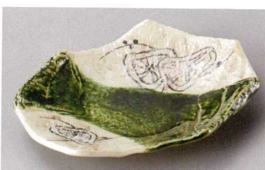
38909-011 御所車7.0変形皿 4,000円 (21.2×16.2×3.6cm)