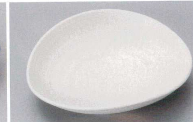
39418-491 白釉サラダ鉢 1,550円 (21.5×19.2×5.5cm)