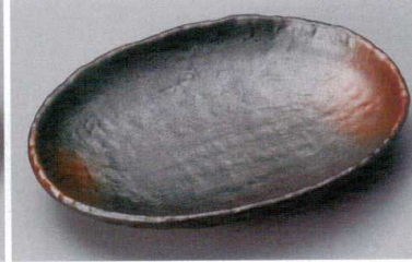
39403-641 備前風石目7.0小判皿 1,680円 (22×16×3.5cm)