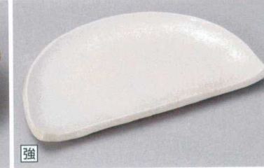
39416-061 白山7.0半月皿 1,550円 (21.4×12.7×1.9cm)