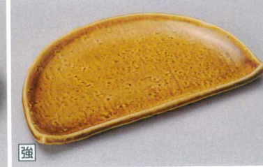
39413-061 黄海7.0半月皿 1,620円 (21.4×12.7×1.9cm)