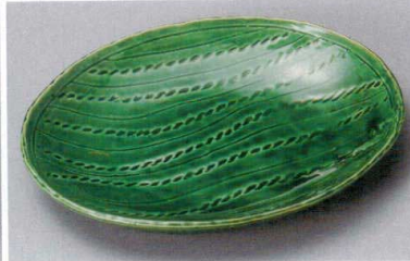
39402-651 総織部縄目楕円皿 1,800円 (24×19.6×3.8cm)