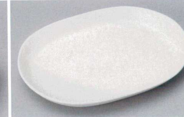
39419-491 白釉楕円大皿 1,550円 (24.7×18.7×2.4cm)