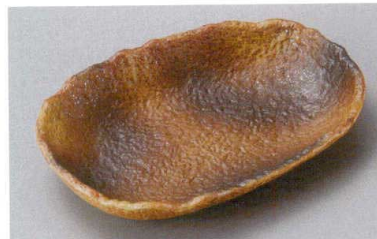
39410-181 信楽吹5.0楕円深皿 1,200円 (15.6×12×3.3cm) 39411-181 信楽吹6.0楕円深皿 1,750円 (20×13.6×3.4cm)