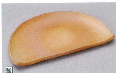
39404-061 赤藤7.0半月皿 1,670円 (21.4×12.7×1.9cm)