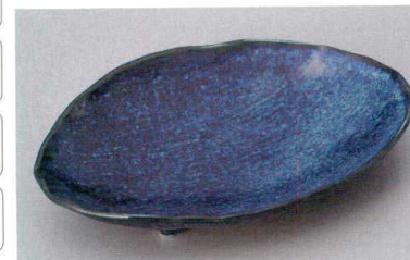
39417-491 窯変紺三つ足楕円皿 1,550円 (22×15.2×4.2cm)