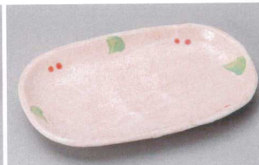
39405-021 桜志野小判6.5多用皿 1,200円 (19.5×12.3×3.1cm) 39406-021 桜志野小判8.0多用皿 1,700円 (24×15.7×3.5cm)