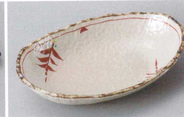
39415-151 灰釉赤絵小判6.0鉢 1,800円 (20.4×13.7×3.7cm)