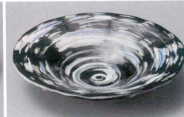
39407-451 水輪4.0皿 940円 (12×11.5×2.7cm) 39408-451 水輪5.0皿 1,380円 (17.2×16.7×4cm) 39409-451 水輪7.0皿 1,650円 (20×19.7×4cm)