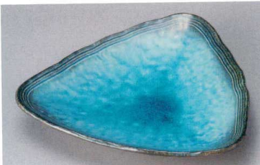
39401-541 藍染スカイ三角皿(大) 1,850円 (22.5×22.5×3.7cm)