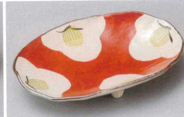
39412-181 手描椿三つ足楕円皿 1,950円 (21.5×15×3.7cm)