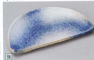
39414-061 青蛭7.0半月皿 1,620円 (21.4×12.7×1.9cm)