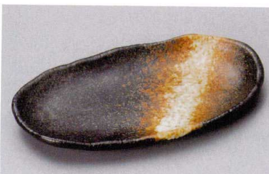
39505-461 いぶし備前 手造風万能皿 1,410円 (21×11.5×2.5cm)