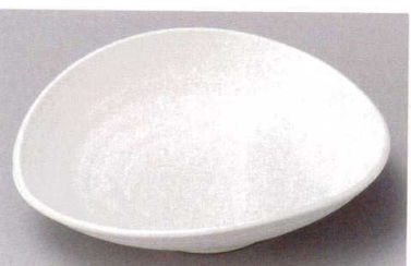
39511-181 白パールたわみ楕円鉢 1,500円 (21.8×19.4×6cm)