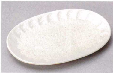
39501-361 白粉引だ円皿 1,500円 (23.6×16.4×2.3cm)