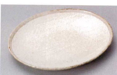
39510-631 白唐津縄目楕円深皿 1,350円 (23.8×19.8×3cm)