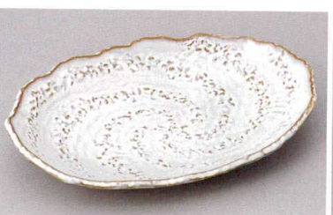
39515-711 白うず8号小判皿 1,300円 (24×16.5×3.5cm)