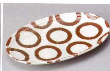
39504-161 カカオリング楕円皿 1,430円 (22×13.8×2cm)