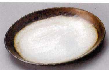
39508-631 窯変金彩縄目楕円深皿 1,350円 (23.8×19.8×3cm)