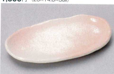
39506-461 桜志野 手造風万能皿 1,410円 (21×11.5×2.5cm)