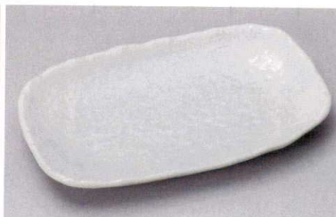
39502-091 粉引白刷毛7.0長角皿 1,180円 (20×13.3×3cm) 39503-091 粉引白刷毛8.0長角皿 1,500円 (23×14.8×3cm)