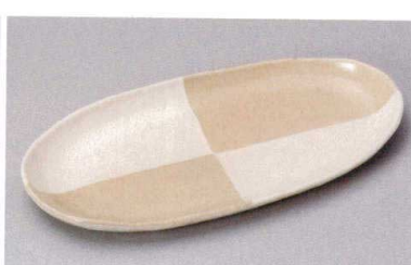
39507-131 唐津化粧楕円焼物皿 1,400円 (25.7×12.8×1.7cm)