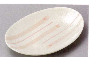
39514-321 かりんフルーツ皿 1,270円 (20.2×14×2.5cm)