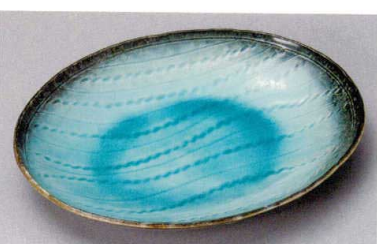
39509-631 均窯スカイ縄目楕円深皿 1,350円 (23.8×19.8×3cm)