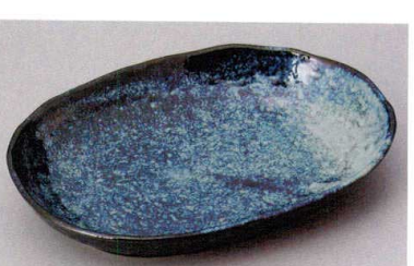
39517-671 楕円深皿 窯変紺 990円 (22.7×16×3.5cm)