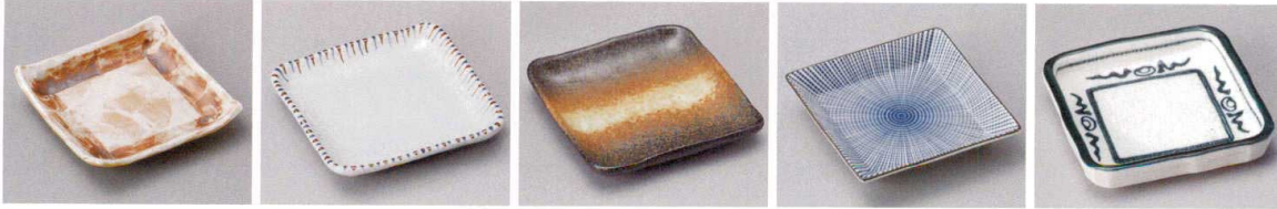
40116-311 志野4.0正角皿 890円 (12.8×12.8×2.5cm) 40117-091 京十草正角 中皿 880円 (14×14×2.2cm) 40118-091 黒備前正角 取皿 880円 (14×14×2.2cm) 40119-161 千段十草角皿(小) 810円 (11.6×11.6×2.2cm) 40120-311 瑞雲切立銘々皿 760円 (9.5×9.5×2cm)