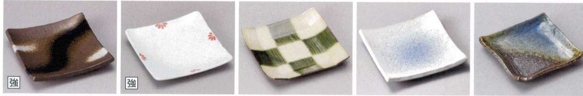
40106-061 美以留4.0正角皿 1,040円 (12.5×12.5×2.4cm) 40107-131 小花(赤)正角銘々皿 1,110円 (12×12×1.8cm) 40108-341 織部市松コヨリ取皿 1,100円 (12.3×12.3×2cm) 40109-151 瑠璃ウノフ5.0正角皿 1,100円 (12.7×12.7×2.5cm) 40110-331 青吹角銘々皿 1,000円 (12.5×12.5×2.2cm)