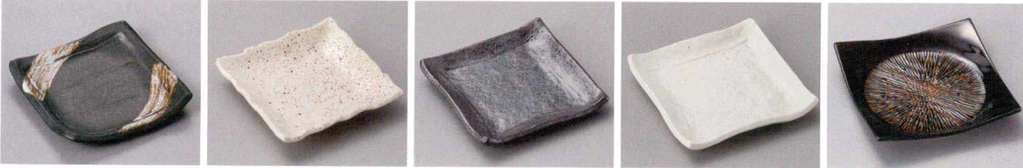
40121-251 栗色刷毛目剝厚銘々皿 1,350円 (14.5×14×2.4cm) 40122-181 萩志野チギリ銘々皿 730円 (15.5×15.5×3cm) 40123-401 黒釉正角銘々皿 740円 (12.5×2.2cm) 40124-401 白釉正角銘々皿 740円 (12.5×2.2cm) 40125-251 漆黒乱十草4.5正角皿 600円 (13.5×13.5×3cm)