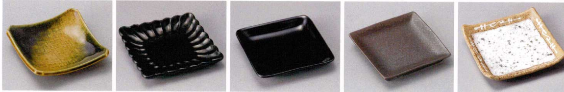
40111-321 黄瀬戸正角4.0皿 990円 (11×11×2.3cm) 40112-281 黒ガラスマット菊型角取皿 1,270円 (15×15×2.5cm) 40113-091 黒取皿小 880円 (12×12×2.3cm) 40114-081 仙窯変黒S 950円 (10.3×10.3×1.7cm) 40115-151 うのふ茶唐津4.0角皿 900円 (12.3×12.1×2.3cm)