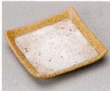
40903-341 うのふ茶唐津4.0角皿 980円 (12.3×12.3×2.2cm)