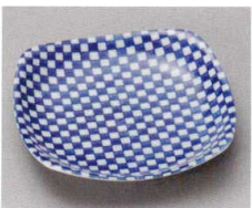
40921-461 市松正角5.5皿 650円 (15×15×3cm)