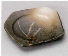
40907-531 金彩すずき取皿 950円 (16×15×2.4cm)