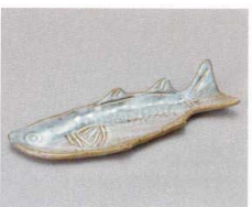
40927-141 お魚出世魚 イナ皿 2,300円 (21×8×2.5cm)