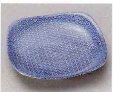
40918-461 青海波正角5.5皿 650円 (15×15×3cm)