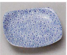
40923-461 春秋正角5.5皿 650円 (15×15×3cm)