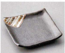
40913-321 黒伊賀十草12cm正角銘々皿 760円 (12×12.3×2.5cm)