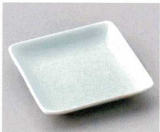
40908-091 青磁取皿小 920円 (12×12×2.3cm)