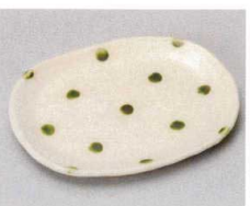
40928-451 志野玉水楕円取皿 1,900円 (16.2×13.5×1.3cm) 手洗い