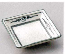
40924-311 瑞雲正角銘々皿 630円 (10.5×10.5×2.6cm)