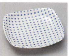
40920-461 豆紋り正角5.5皿 650円 (15×15×3cm)