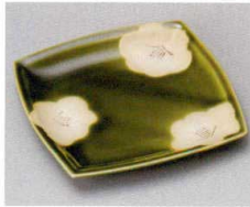
40906-131 織部椿銘々皿 950円 (13×13×1.6cm)