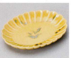
40930-141 黄瀬戸菊割取り皿 1,800円 (17.5×13.5×2.5cm)