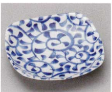
40922-461 たご唐草正角5.5皿 650円 (15×15×3cm)