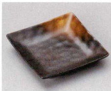
40911-641 金茶吹12cm正角皿 950円 (12.5×12.5×2.6cm)