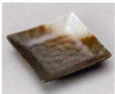
40912-671 白吹天目正角小皿 900円 (12.5×12.5×2.5cm)