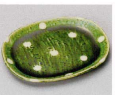
40929-451 織部玉水楕円取皿 1,900円 (16.2×13.5×1.3cm) 手洗い