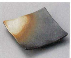
40915-311 夜明四角皿(小) 740円 (12.8×12.4×2.4cm)