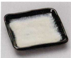
40916-571 雲竜正角 中皿 730円 (13.7×13.7×2.2cm)