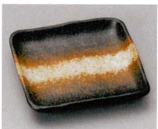
40917-571 黒備前正角皿 730円 (13.5×13.5×2.2cm)