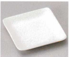
40909-191 白磁角取皿(小) 920円 (12×12×2.3cm)