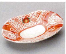
40926-471 赤絵間取双子皿 3,100円 (18.3×11.8×3.7cm)