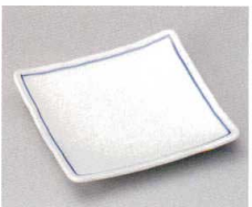
40910-341 浏ライン4.0正角皿 900円 (12.5×12.5×2.2cm)