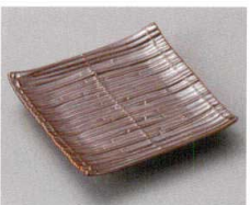
40914-151 鉄砂スタレ角銘々皿 740円 (11.6×11.6×2.4cm)