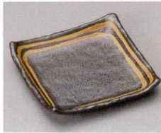
40901-341 黒ライン4.0角皿 980円 (12×12×2.3cm)