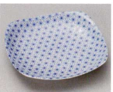
40919-461 麻の葉正角5.5皿 650円 (15×15×3cm)