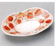
40925-471 赤絵木の葉双子皿 3,100円 (18.3×11.8×3.7cm)