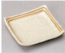
40902-341 クリーム粉引ライン4.0角皿 980円 (12×12×2.3cm)