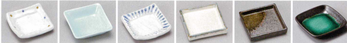
42119-511 二色水玉角小皿 550円 (7×6.8×1.7cm) 42120-191 青磁角小皿 550円 (8.8×8.8×2.5cm) 42121-511 緑十草角小皿 550円 (7×6.8×1.7cm) 42122-291 ウノフ角小皿 540円 (7.7×7.7×1.3cm) 42123-291 黒伊賀角小皿 540円 (7.7×7.7×1.3cm) 42124-221 深海グリーン角小皿 550円 (9×9×2cm)