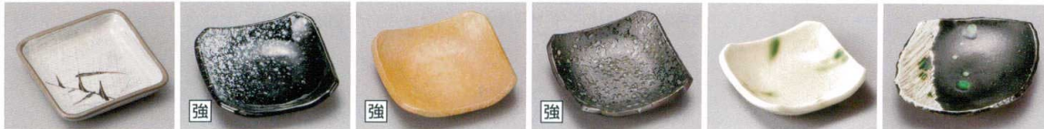
42101-021 白刷笹正角小皿 750円 (9.3×9.3×1.8cm) 42102-061 雪雷正角小皿 740円 (8.7×8.7×2.3cm) 42103-061 赤藤正角小皿 740円 (8.8×8.8×2.3cm) 42104-061 黒藤正角小皿 740円 (8.8×8.8×2.3cm) 42105-311 黄釉織部流し布目正角小皿 720円 (9×9×2.5cm) 42106-531 黒織部千代口 720円 (11×9.2×2.5cm)