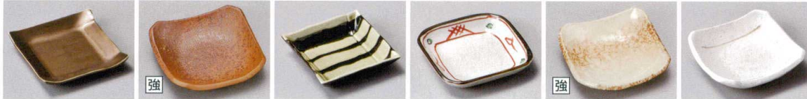
42113-401 天目結晶角小皿 690円 (8×1.5cm) 42114-461 南蛮吹3.0正角皿 610円 (8.5×8.5×2.5cm) 42115-321 深世界3.0正角小皿 610円 (8.2×8.2×2.2cm) 42116-151 赤矢来小皿 680円 (8.3×1.5cm) 42117-061 白藤改正角小皿 590円 (8.7×8.7×2.3cm) 42118-151 唐津錆筋正角3.0皿 570円 (8.7×8.7×2.4cm)