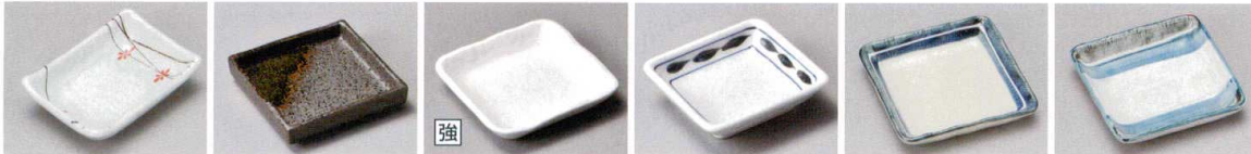
42125-341 青磁花散5し浜付長角小皿 500円 (9×6.5×2.5cm) 42126-401 伊賀正角小皿 540円 (7.6×1.7cm) 42127-151 白磁銘々皿(小) 700円 (8.6×8.6×1.5cm) 42128-321 点トクサ小皿 460円 (8.5×7.6×2.5cm) 42129-091 一珍ライン角小皿 450円 (8.5×8.5×1.6cm) 42130-091 一珍二色ライン角小皿 450円 (8.8×8.8×1.5cm)