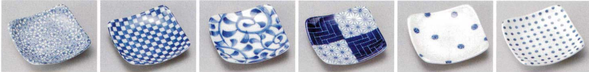
42131-461 春秋正角3.0皿 440円 (8.9×8.9×2cm) 42132-461 市松正角3.0皿 440円 (8.9×8.9×2cm) 42133-461 たご唐草正角3.0皿 440円 (8.9×8.9×2cm) 42134-461 刺し子正角3.0皿 440円 (8.9×8.9×2cm) 42135-461 点紋正角3.0皿 440円 (8.9×8.9×2cm) 42136-461 豆紋正角3.0皿 440円 (8.9×8.9×2cm)