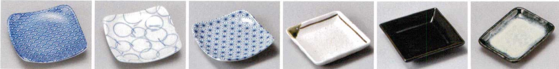
42137-461 青海波正角3.0皿 440円 (8.9×8.9×2cm) 42138-461 ざーくる正角3.0皿 440円 (8.8×8.8×2cm) 42139-05-461 麻の葉四角小皿 440円 (9×9×2cm) 42140-09-151 志野茶ライン正角小皿 400円 (8.8×8.8×1.5cm) 42141-331 黒釉角小皿 380円 (8×8×1.5cm) 42142-571 雲竜長角小皿 390円 (10.3×8×1.8cm)