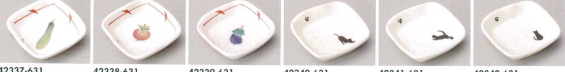
42337-631 きゅうり角小皿 480円 (6.7×6.7×1.5cm) 42338-631 カブ角小皿 480円 (6.7×6.7×1.5cm) 42339-631 ナス角小皿 480円 (6.7×6.7×1.5cm) 42340-631 シルエットネコ角小皿(のび) 480円 (6.7×6.7×1.5cm) 42341-631 シルエットネコ角小皿(はね) 480円 (6.7×6.7×1.5cm) 42342-631 シルエットネコ角小皿(すわり) 480円 (6.7×6.7×1.5cm)