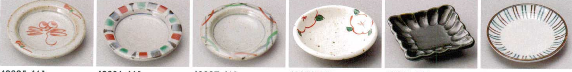
42325-461 古染赤とんぼ豆小皿 720円 (6.5×1.5cm) 42326-461 古染淵三色十草豆小皿 720円 (6.5×1.5cm) 42327-461 古染赤武蔵野豆小皿 720円 (6.5×1.5cm) 42328-321 白イロ赤絵花3.0玉淵皿 580円 (9.5×2.3cm) 42329-281 黒ガラスマット菊型角小皿 730円 (9×9×2cm) 42330-131 二色十草3.0小皿 550円 (9×1.6cm)