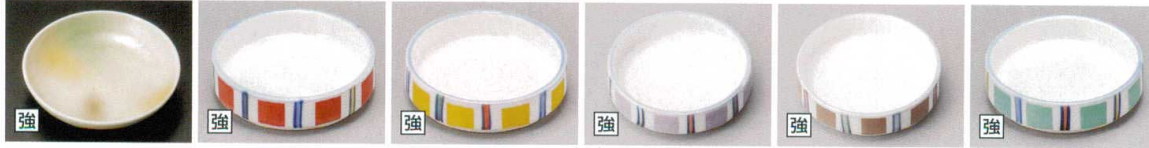
42307-461 三色吹あすか3.0丸皿 1,020円 (9.5×2cm) 42308-461 赤だみ十草切立丸小皿 840円 (8×2cm) 42309-461 黄だみ十草切立丸小皿 840円 (8×2cm) 42310-461 紫だみ十草切立丸小皿 840円 (8×2cm) 42311-461 茶だみ十草切立丸小皿 840円 (8×2cm) 42312-461 グリーンだみ十草切立丸小皿 840円 (8×2cm)