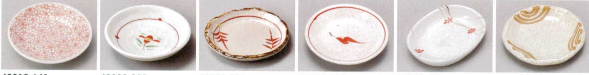
42319-641 赤小紋3.0皿 790円 (10×1.8cm) 42320-051 赤絵小花3.0皿 780円 (9.6×2.4cm) 42321-151 灰釉赤絵小皿 840円 (10.6×10.1×1.7cm) 42322-641 唐辛子3.0皿 690円 (10×1.8cm) 42323-341 青磁花散らし楕円小皿 680円 (11×8.4×2cm) 42324-191 粉引木目丸小皿 660円 (8.8×1.5cm)