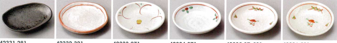
42331-281 黒藍染カヤ目楕円皿(小) 570円 (11×8.9×2cm) 42332-321 晴美3.0丸皿 530円 (9.9×1.6cm) 42333-071 粉引釉花だより玉淵3寸皿 510円 (9.5×2.3cm) 42334-071 青磁赤絵花紋3.0皿 510円 (9.6×2.3cm) 42335-07・531 粉引釉新赤絵玉淵3.0皿 510円 (9.5×2.2cm) 42336-531 赤絵玉淵2.8皿 480円 (9×2cm)