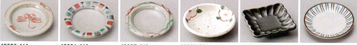
42325-461 古染赤とんぼ豆小皿 720円 (6.5×1.5cm) 42326-461 古染淵三色十草豆小皿 720円 (6.5×1.5cm) 42327-461 古染赤武蔵野豆小皿 720円 (6.5×1.5cm) 42328-321 白イロボ赤絵花3.0玉淵皿 580円 (9.5×2.3cm) 42329-281 黒ガラスマット菊型角小皿 730円 (9×9×2cm) 42330-131 二色十草3.0小皿 550円 (9×1.6cm)