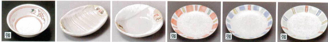
42301-461 赤万歴2.8反井 1,760円 (8.5×2.5cm) 42302-411 粉引赤入小判小皿 1,150円 (11.5×8.5×1.5cm) 42303-411 粉引赤入丸小皿 1,150円 (9.5×2cm) 42304-461 赤だみ十草3.5丸皿 1,180円 (10.5×2.5cm) 42305-461 ござだみ十草3.5丸皿 1,180円 (10.5×2.5cm) 42306-461 グリーンだみ十草 3.5丸皿 1,180円 (10.5×2.5cm)