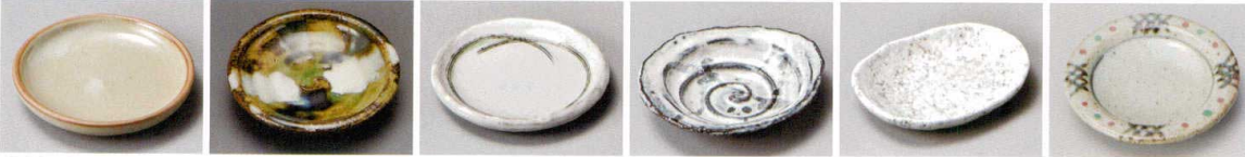
42531-251 アラざり豆皿 940円 (10.8×1.8cm) 42532-471 三彩小皿 750円 (12.2×2.3cm) 42533-151 織部結び小皿 740円 (9.8×1.4cm) 42534-251 手造りちぎり楕円小皿 770円 (10.5×8.8×2.2cm) 42535-321 岩白吹豆小皿(小判) 670円 (10.5×8.2×1.8cm) 42536-461 古染格子赤点つなぎ豆小皿 720円 (6.5×1.5cm)