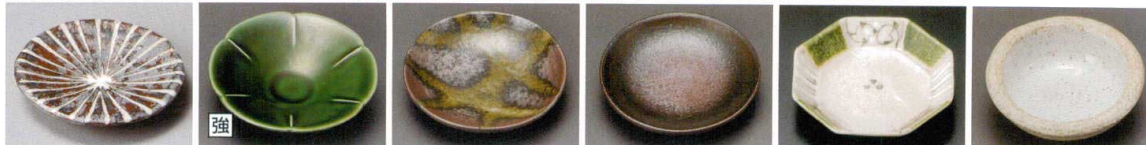
42501-081 鼠十草小皿 2,100円 (8×1.5cm) 42502-471 織部輪花反平皿 1,750円 (11.5×2.8cm) 42503-471 炭化火だすき3.0皿 1,500円 (9.6×2cm) 42504-471 備前くし目3.0皿 1,500円 (9.8×2cm) 42505-141 志野織部 八角小皿 唐草絵 1,400円 (11.5×11.5×2.3cm) 42506-461 手造石焼内青磁3.3玉淵深丸皿 1,320円 (10×3.5cm)