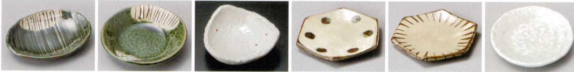
42519-461 織部丸紋(クシメ)3.5楕円皿 1,090円 (11.5×8.5×1.5cm) 42520-461 織部丸紋3.0深丸皿 1,030円 (9.5×2cm) 42521-341 白押花三角盛皿(S) 1,000円 (8.8×8.5×2.7cm) 42522-451 焼しめ六角小皿水玉(手造り) 1,000円 (10.8×9×0.6cm) 42523-451 焼しめ六角小皿十草(手造り) 1,000円 (10.8×9×0.6cm) 42524-531 灰貫入荒石目11cm小皿 1,000円 (11×2cm)