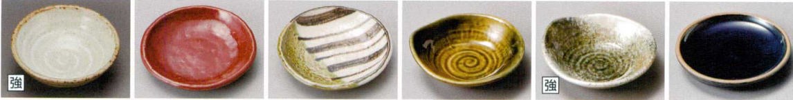
42525-461 石焼かいらぎ3.3深丸皿 990円 (10×3.5cm) 42526-461 紅ゆず3.5丸皿 990円 (11.5×2cm) 42527-461 十草織部3.5丸皿 960円 (11.5×2cm) 42528-321 黄瀬戸変形3.3皿 880円 (10.2×9.7×2.9cm) 42529-151 緑川変形3.3皿 820円 (10.1×9.6×3.1cm) 42530-251 ナス紺豆皿 940円 (10.8×1.8cm)