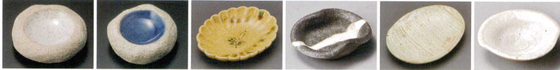
42507-461 手造石焼内青磁(厚口)丸小皿 1,320円 (8×2.5cm) 42508-461 手造石焼内紺袖(厚口)丸小皿 1,320円 (8×2.5cm) 42509-141 黄瀬戸菊割小皿 1,280円 (11.5×9×2.5cm) 42510-431 黒窯変掛け分け変型小皿 2,000円 (11×9×3.4cm) 42511-461 白唐津(クシメ)3.5楕円皿 1,190円 (11.5×9×1.5cm) 42512-081 サビ梅花皮ひねり小皿 1,200円 (9.4×2.5cm)