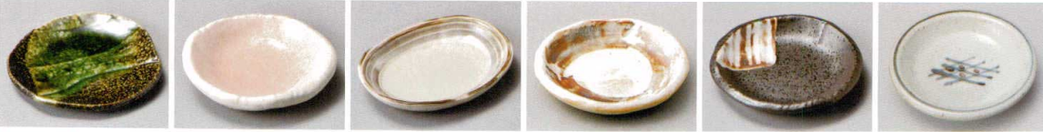
42537-401 深山織部手作り3.0皿 800円 (10×9.5×7cm) 42538-401 桜志野手作り小皿 580円 (9.9×9.4×2.5cm) 42539-321 くりちよこ小判小皿 580円 (10.5×8×1.3cm) 42540-131 ねずみ志野小皿 540円 (8.7×1.4cm) 42541-321 黒伊賀十草小皿 500円 (8.7×1.6cm) 42542-461 古染格子見込豆小皿 590円 (6.5×1.5cm)