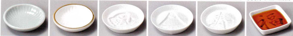
42925-151 アアマリトヒカンナ3.0丸皿 780円 (9.6×2.3cm) 42926-151 アアマリトヒカンナ3.5丸皿 880円 (10.8×2.5cm) 42927-151 茶淵ヒカンナ3.0丸皿 780円 (9.6×2.3cm) 42928-151 茶淵ヒカンナ3.5丸皿 880円 (10.8×2.5cm) 42929-151 鯛醤油小皿 550円 (8.1×1.7cm) 42930-151 富士山醤油小皿 550円 (8.1×1.7cm)