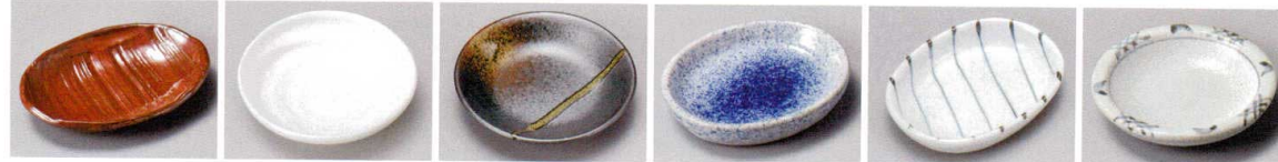
42907-311 辰砂小判小皿 750円 (11.6×8.6×2cm) 42908-641 白ろくろ目3.0皿 750円 (8.8×2cm) 42909-511 南蛮吹流し3.0皿 680円 (9.9×1.8cm) 42910-151 瑠璃ウノフ3.0小判皿 680円 (9.2×7.6×1.5cm) 42911-341 ストライプ小判小皿 650円 (11×8.5×2cm) 42912-401 古染濁芦3.0皿 780円 (9.4×2cm)