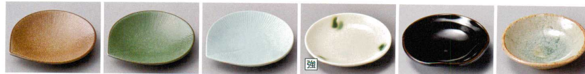
42901-081 モア窯変茶12.5cm小皿 780円 (12.5×11×2cm) 42902-081 モア窯変グリーン12.5cm小皿 780円 (12.5×11×2cm) 42903-081 モア淡ブルー12.5cm小皿 780円 (12.5×11×2cm) 42904-311 黄釉織部流し丸小皿(強化) 870円 (10.8×2cm) 42905-311 結晶天目花型小皿 810円 (11.3×2.5cm) 42906-451 緑雲3.0丸皿 750円 (9.7×2.7cm)