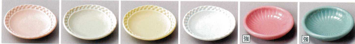
42919-491 パステルピンク3.0皿 300円 (10×2.1cm) 42920-491 パステルグリーン3.0皿 300円 (10×2.1cm) 42921-491 パステルイエロー3.0皿 300円 (10×2.1cm) 42922-491 パステルブルー3.0皿 300円 (10×2.1cm) 42923-151 ピンクヒカンナ3.0丸皿 780円 (9.4×2.1cm) 42924-151 ヒントヒカンナ3.5丸皿 880円 (10.5×2.3cm)