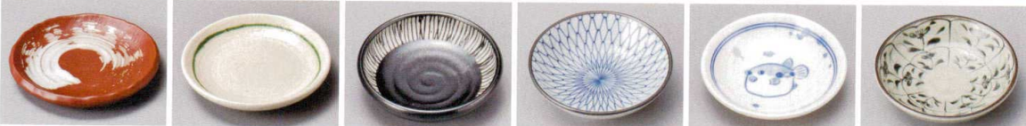
42931-101 寿丸くぼみ醤油皿 550円 (8.3×1.8cm) 42932-101 福角くぼみ醤油皿 550円 (8.1×1.8cm) 42933-101 吹フグ玉淵2.8皿 300円 (9.2×2cm) 42934-101 なずな六ベエ3.3皿 300円 (9.8×2.5cm) 42935-311 朱白刷毛小皿 520円 (8.6×1.2cm) 42936-321 志野ライン3.0小皿 460円 (9.2×2cm)