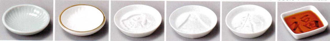
42925-151 アアマリトヒカンナ3.0丸皿 780円 (9.6×2.3cm) 42926-151 アアマリトヒカンナ3.5丸皿 880円 (10.8×2.5cm) 42927-151 茶淵ヒカンナ3.0丸皿 780円 (9.6×2.3cm) 42928-151 茶淵ヒカンナ3.5丸皿 880円 (10.8×2.5cm) 42929-151 鯛醤油小皿 550円 (8.1×1.7cm) 42930-151 富士山醤油小皿 550円 (8.1×1.7cm)