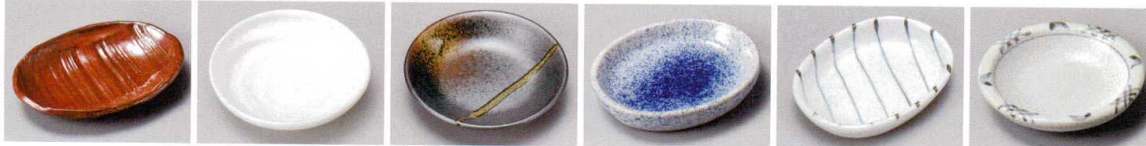
42907-311 辰砂小判小皿 750円 (11.6×8.6×2cm) 42908-641 白ろくろ目3.0皿 750円 (8.8×2cm) 42909-511 南蛮吹流し3.0皿 680円 (9.9×1.8cm) 42910-151 瑠璃ウノフ3.0小判皿 680円 (9.2×7.6×1.5cm) 42911-341 ストライプ小判小皿 650円 (11×8.5×2cm) 42912-401 古染濁芦3.0皿 780円 (9.4×2cm)