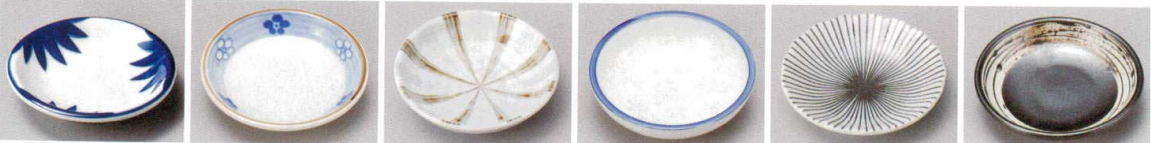
42937-541 鉄結晶グシ目2.7深皿 330円 (8.2×2.3cm) 42938-541 網目2.8豆鉢 320円 (9×2.6cm) 42939-621 吹フグ玉淵2.8皿 300円 (9.2×2cm) 42940-341 なずな六ベエ3.3皿 300円 (9.8×2.5cm) 42941-331 大輪菊玉淵小皿 300円 (9.3×2cm) 42942-631 流れ梅玉淵3.0皿 300円 (9.5×2cm)