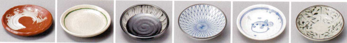
42931-101 寿丸くぼみ醤油皿 550円 (8.3×1.8cm) 42932-101 福角くぼみ醤油皿 550円 (8.1×1.8cm) 42933-101 吹フグ玉淵2.8皿 300円 (9.2×2cm) 42934-101 なずな六ベエ3.3皿 300円 (9.8×2.5cm) 42935-311 朱白刷毛小皿 520円 (8.6×1.2cm) 42936-321 志野ライン3.0小皿 460円 (9.2×2cm)