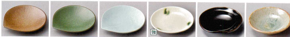
42901-081 モア窯変茶12.5cm小皿 780円 (12.5×11×2cm) 42902-081 モア窯変グリーン12.5cm小皿 780円 (12.5×11×2cm) 42903-081 モア淡ブルー12.5cm小皿 780円 (12.5×11×2cm) 42904-311 黄釉織部流し丸小皿(強化) 870円 (10.8×2cm) 42905-311 結晶天目花型小皿 810円 (11.3×2.5cm) 42906-451 緑雲3.0丸皿 750円 (9.7×2.7cm)