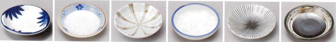
42937-541 鉄結晶クシ目2.7深皿 330円 (8.2×2.3cm) 42938-541 網目2.8豆鉢 320円 (9×2.6cm) 42939-621 吹フグ玉淵2.8皿 300円 (9.2×2cm) 42940-341 なずな六ベエ3.3皿 300円 (9.8×2.5cm) 42941-331 大輪菊玉淵小皿 300円 (9.3×2cm) 42942-631 流れ梅玉淵3.0皿 300円 (9.5×2cm)