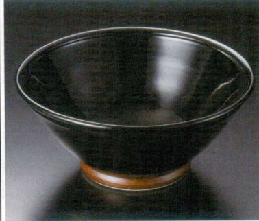
44002-471 黒尺鉢 9,900円 (29.5×13cm)