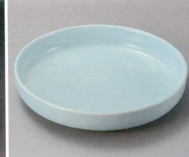
44012-48-711 青地10.0盛鉢 3,800円 (31×6cm)