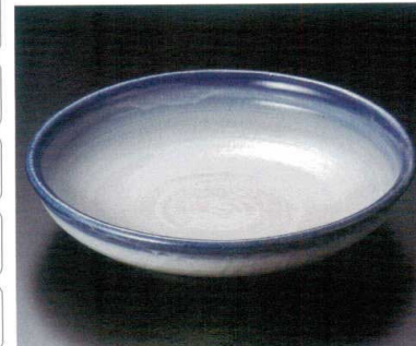
44010-711 清流10号盛鉢 6,300円 (29.5×6cm)