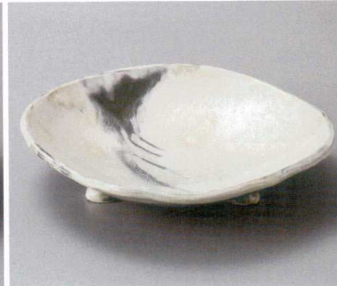
44005-431 白化粧ぼかし三足大鉢 9,020円 (30×6.5cm)