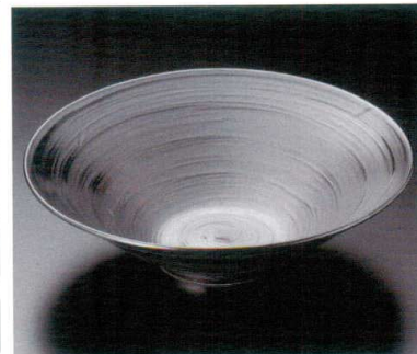
44007-541 刷毛巻銀彩10.0反鉢 9,900円 (31×9.3cm)