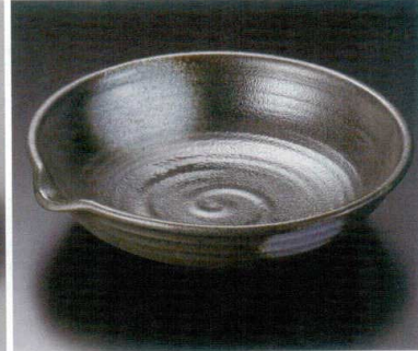
44006-131 白吹黒水晶9.5片口大鉢 8,160円 (29.5×28.5×6.7cm)