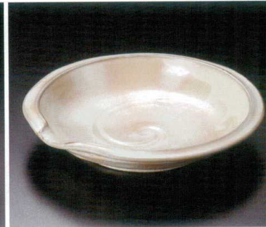
44008-461 御本手9.5片口形盛鉢 7,000円 (29×5cm)