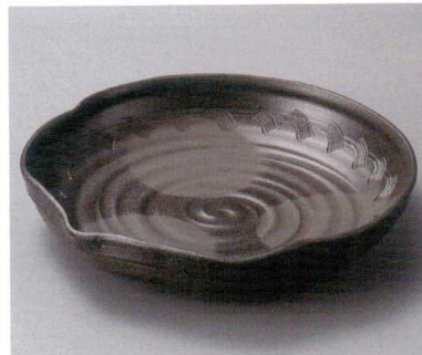
44004-081 炭化土瓢型尺盛鉢 9,300円 (32.4×31×7cm)