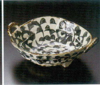
44009-361 たご唐草両手付大鉢 6,300円 (30.5×26×10cm)