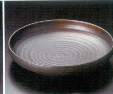
44011-641 備前風10.0切立盛鉢 5,700円 (31×6cm)