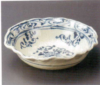
44001-181 安南花紋丸尺鉢(手造り) 10,500円 (30×8cm)