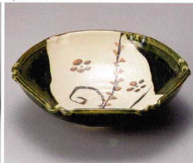
44507-471 織部草花紋あずけ鉢 5,000円 (21.2×7cm) 手造り 44508-471 織部草花紋深盛鉢 6,500円 (25×7cm) 手造り