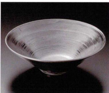
44514-541 刷毛巻銀彩9.0反鉢 8,000円 (27×8.8cm)