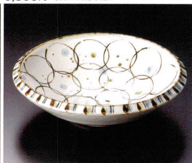
44512-471 粉引ドロップ盛鉢 6,500円 (23×7cm) 手造り