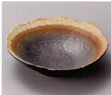
44502-311 夜明け8.0盛鉢 6,570円 (25×6.4cm)