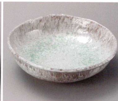
44503-48・711 青釉8.0盛鉢 3,700円 (24×6.8cm) 44504-48・711 青釉10.0盛鉢 7,500円 (29.5×8.5cm)