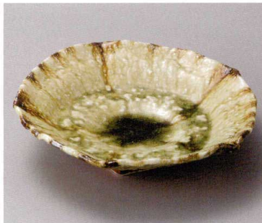
44501-181 灰釉五角 大盛込鉢 8,050円 (28×6.8cm)