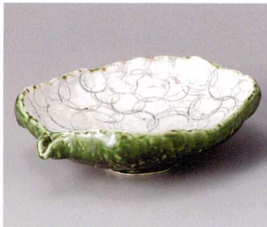
44506-011 しゃぼん外織部大平鉢 6,500円 (26.5×22×8cm)