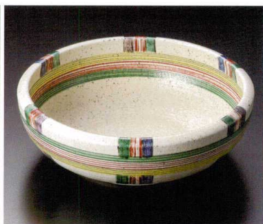
44515-641 荒吹春日8.0盛鉢 6,200円 (24×8cm)