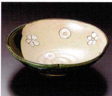
44511-471 織部幾何紋浅盛鉢 6,500円 (24.3×7cm) 手造り