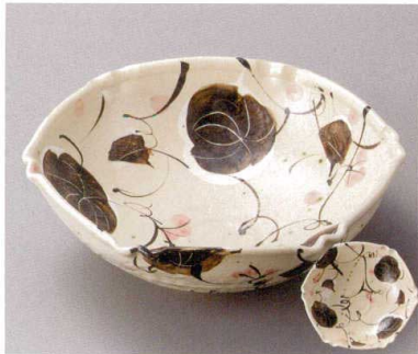
44505-451 鎗志野山帰来六角盛鉢 6,500円 (26×8.5cm)