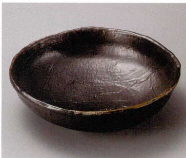
44509-48・711 琥珀8.0盛鉢 3,700円 (24×6.8cm) 44510-48・711 琥珀10.0盛鉢 7,500円 (29.5×8.5cm)