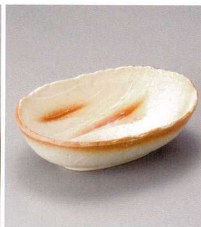
45313-641 ヒダスキ楕円鉢(小) 1,000円 (16.1×12.2×6cm) 45314-641 ヒダスキ楕円鉢(大) 2,100円 (24.4×16.5×7.8cm)