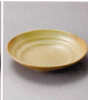
45304-231 野あそび9.5ミツワ盛皿 2,500円 (29×6.2cm)