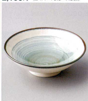
45319-161 さばトラ8.0盛鉢 1,720円 (24.2×8cm)