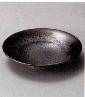
45317-081 黒真珠輪二重8寸浅鉢 1,800円 (24.8×4.8cm)