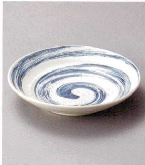
45307-011 粉吹青流9.5ミツワ盛皿 2,200円 (29×6cm)