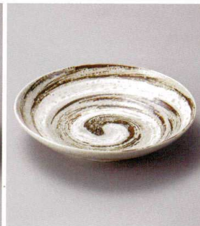
45309-01-641 鳴門9.5ミツワ盛皿 2,170円 (29×6cm)