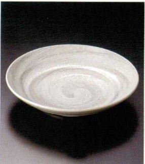
45310-641 白雪9.5盛皿 2,170円 (29×6cm)