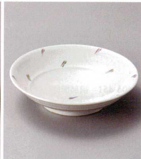
45308-221 斜め十草8.0鉢 2,200円 (25×6cm)