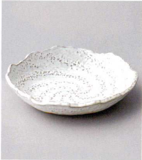
45306-711 白うず8号鉢 2,500円 (24.5×21.5×5cm)