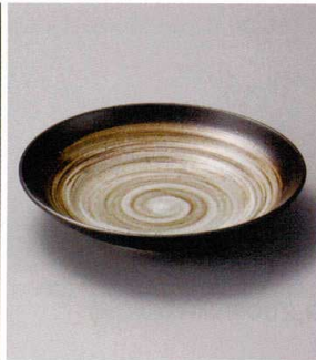
45303-231 深山雪9.5ミツワ盛皿 2,500円 (29.4×6.1cm)