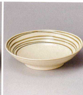
45305-161 ビードロらいん250ポウル 2,480円 (25×6cm)