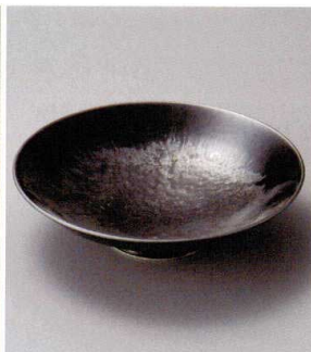
45312-011 織部9.0盛鉢 2,160円 (28.7×7.7cm)