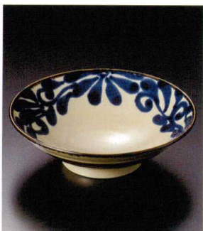
45318-471 るり唐草8.0めん鉢 1,700円 (24.5×7.5cm)