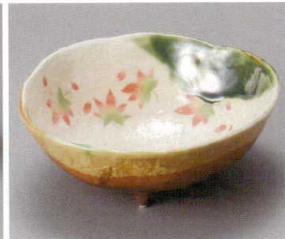
45611-601 織部春秋三ツ足大鉢 4,500円 (21×19×8cm)