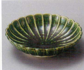
45602-451 総織部菊花盛鉢 4,800円 (21×5.4cm)