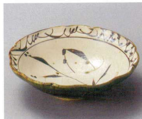
45605-121 織部芦花形盛鉢 4,700円 (20.5×6.2cm)