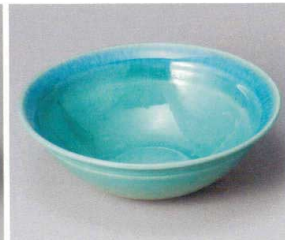
45616-431 トルコブルー7.3ボール 5,000円 (22×7cm)