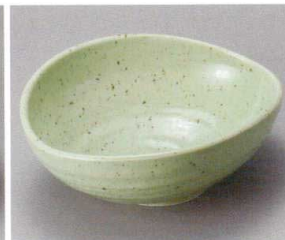
45615-641 益子均窯たまご8.0大鉢 4,700円 (24×19.5×8.5cm)