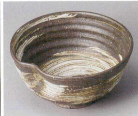
45607-431 刷毛目6.0鉢 4,800円 (18×10cm)