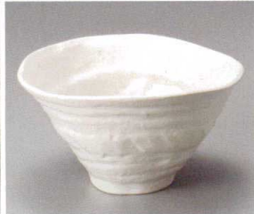
45608-541 白マット 手造り鉢(大) 4,600円 (22×20.5×12cm)