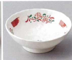
45620-341 花万歴手びねり麵井 4,350円 (20×7.7cm・1,100cc)