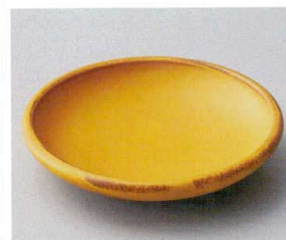
45613-451 満月万能鉢 4,500円 (19.7×4.5cm)