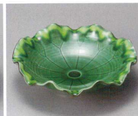
45618-541 緑釉波瀾8.0鉢 4,600円 (24.2×6.7cm)