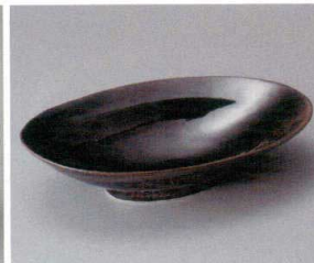
45610-471 萌花椿円鉢 4,500円 (28×18.3×6.5cm)