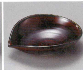
45619-601 うるし釉片口大鉢 4,400円 (21.5×19×6.3cm)