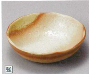
45601-191 春結晶7.0ボール 4,800円 (20.5×5.5cm)