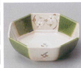
45617-141 志野織部 八角中鉢 唐草絵 4,400円 (16×16×5.5cm)