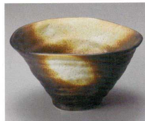
45609-541 黒備前 手造り鉢(大) 4,600円 (22×20.5×12cm)