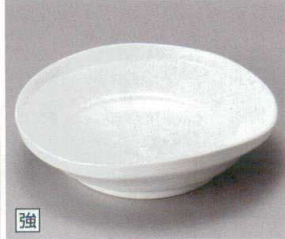
45603-461 白釉 たわみ8.0鉢 4,700円 (23.5×22.5×6cm)