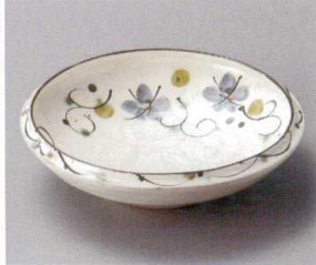
45604-121 ビードロ花絵コマ形盛鉢 4,700円 (20.2×5.5cm)