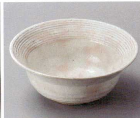
45606-221 粉引櫛目段付6.0鉢 4,600円 (18×7.5cm)