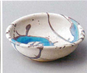
45612-431 碧水河たわみ鉢 4,500円 (20×18×6.5cm)