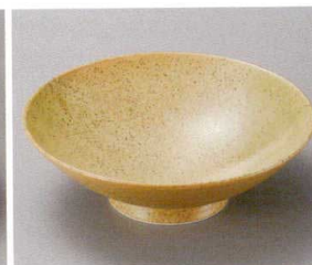
46016-231 野あそび8.0盛鉢 1,900円 (24.6×7.8cm)