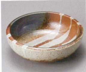
46001-021 天の川8.0盛鉢 2,250円 (23.5×8cm)