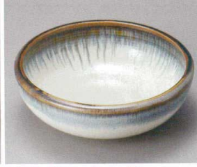
46004-361 うのふ8.0鉢 2,200円 (24×8cm)