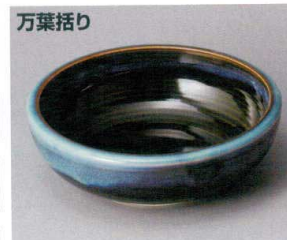
46010-161 6.5鉢 1,280円 (20.3×6.5cm) 46011-161 8.0鉢 2,140円 (23.7×7.9cm)