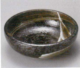
46002-021 白刷毛8.0盛鉢 2,250円 (23.5×8cm)