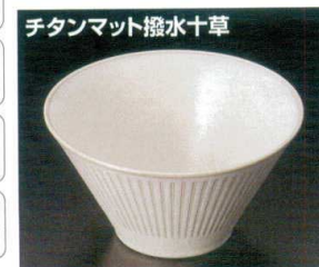
チタンマット撥水十草 46019-461 サラダ(小) 1,300円 (16×8.8cm) 46020-461 サラダ(中) 2,050円 (19×10.2cm)