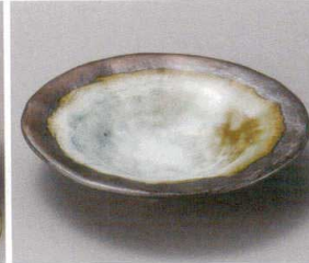
46013-081 窯変金彩ストライプ7.0皿 2,000円 (19.5×4cm)