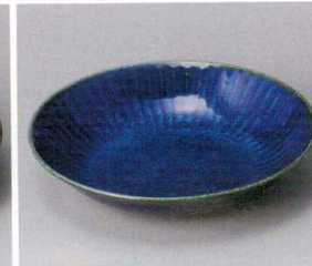
46022-051 ネプチューン7.0深皿 1,900円 (22×4.6cm) 色のバラつきがあります。