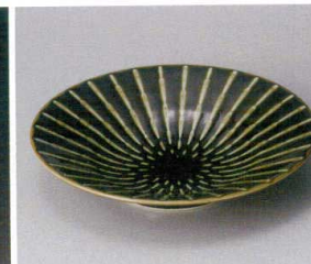
46021-051 織部竹林フォーカス8.0浅鉢 1,800円 (24.7×4.8cm)