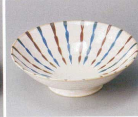
46014-051 アカシア十草25cm 麵鉢 2,100円 (25.3×7.8cm)