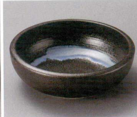
46007-081 青均窯くくりて8.0深鉢 2,150円 (23.7×7.7cm)