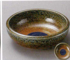
46012-05-491 藍流8.0深鉢 2,000円 (23.5×8cm)