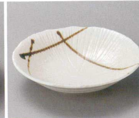
46018-221 金色流し彫十草型大鉢 1,850円 (24×22.5×5.5cm)