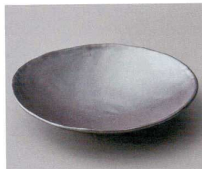
46005-081 黒マット浅ボール 2,200円 (22.5×20.3×3.8cm)