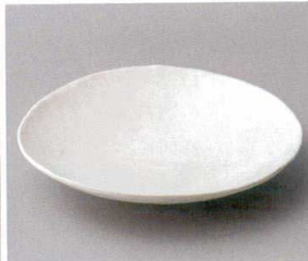
46006-081 白マット浅ボール 2,200円 (22.5×20.3×3.8cm)