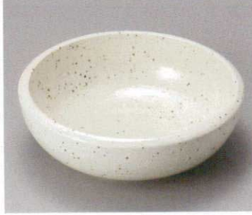
46003-021 白ゆず粉引8.0鉢 2,250円 (24×8cm)