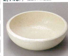
46015-641 荒吹梨地8.0盛鉢 2,150円 (24×8cm)