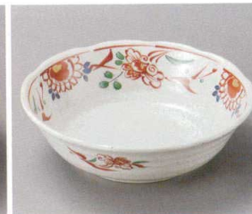
46017-161 万曆7.0鉢 1,880円 (21.6×6.4cm)