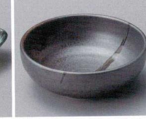
47020-511 南蛮吹流し石目5.5ボール 1,240円 (17×6cm)