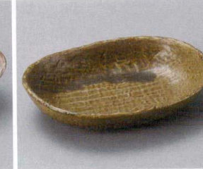
47015-221 夕円(茶)バスケット 1,450円 (22.3×17.2×4.5cm)