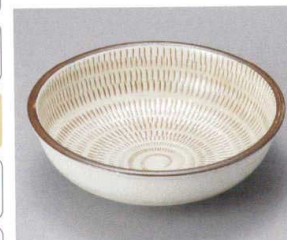
47009-491 飛び鉦玉淵6.5鉢 1,500円 (20.6×6.5cm)