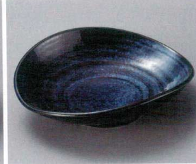
47002-251 窯変たわみ サラダ鉢 1,300円 (22×19.5×5.6cm)