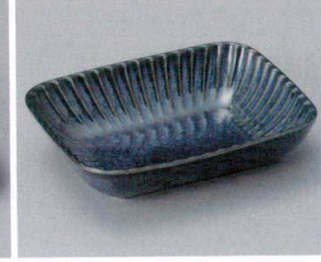
47004-491 窯変しのぎ長角深鉢 1,550円 (19.3×15×4.7cm)