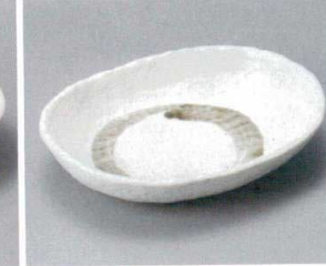
47012-491 白マット刷毛目バスケット(大) 1,480円 (22×17.3×4.7cm)