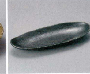
47016-541 黒結晶楕円長盛鉢 1,350円 (33×14×4cm)