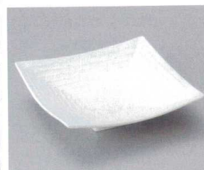
47005-491 白釉千段盛鉢 1,550円 (19×19×5.5cm)