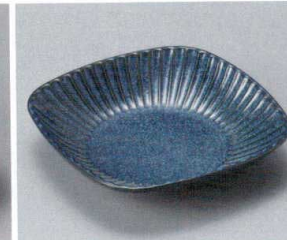
47007-491 窯変紺ソギ四角鉢 1,550円 (19×19×4.2cm)