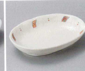
47011-161 粉引たんざく多用皿 1,500円 (21.5×16.3×4cm)