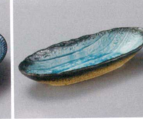
47019-181 風流石目楕円鉢 1,250円 (29×11.5×4.8cm)