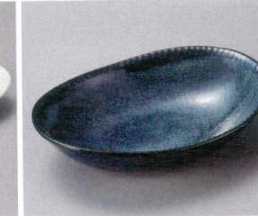
47018-25-491 窯変フリルカレー皿 1,300円 (23.6×17×5cm)