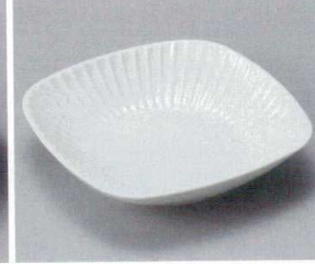
47003-491 白ソギ四角鉢 1,550円 (19×19×4.2cm)