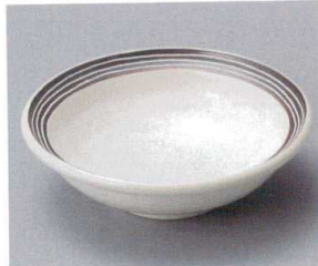
47001-451 志野ライン4.8鉢 1,600円 (14.5×2.2cm)