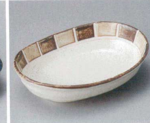
47008-181 サビ間取楕円鉢 1,500円 (20.9×15.3×5.4cm)