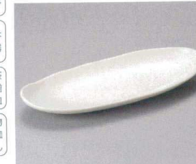
47017-541 白粉引楕円長盛鉢 1,350円 (33×14×4cm)