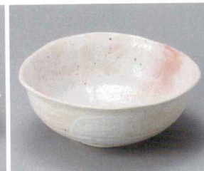
47006-671 桜志野5.0手造三角鉢 1,550円 (15.6×5.6cm)