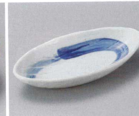
47010-051 ゴス刷毛舟型鉢(小) 1,500円 (24.5×13.5×4cm)