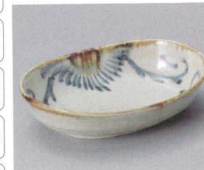
47013-541 安南唐草 21cm楕円盛鉢 1,400円 (21×15.5×5.5cm)