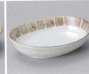
47014-541 粉引ライン 21cm楕円盛鉢 1,400円 (21×15.5×5.5cm)