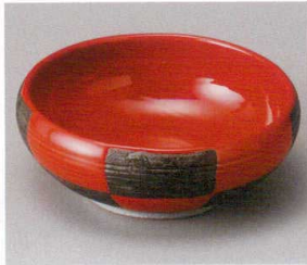
04802-181 筋彫 赤市松5.3ボール 2,980円 (16.5×6.2cm)