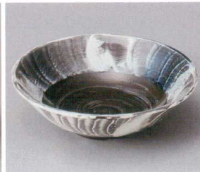
04811-281 青吹白たたき5.0向付 2,900円 (15.5×4.5cm)