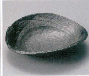
04816-651 大和6.5扇大鉢 3,000円 (20.8×18.5×5.7cm)