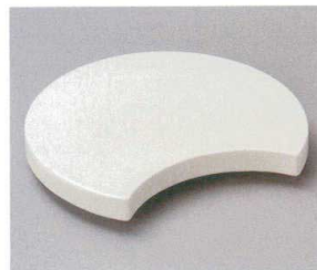
04809-461 クリームマット半月皿 2,900円 (19.5×14.5×2.5cm)