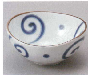
04813-221 渦4.0ダ円小鉢 650円 (13.3×13×6.2cm)