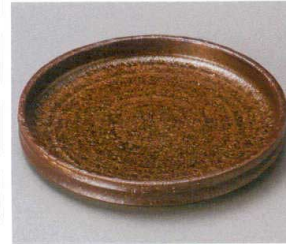
04817-101 金結晶切立皿(小) 3,200円 (17.5×2.6cm)