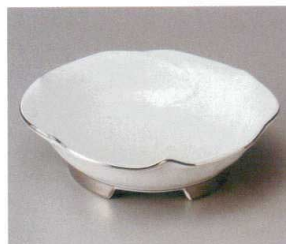
04805-181 プラチナ花形多菜鉢 2,950円 (14.7×4cm)