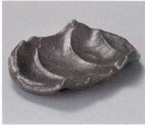
04804-011 黒石釉岩彫盛鉢(大) 2,960円 (20×14.5×4.5cm)