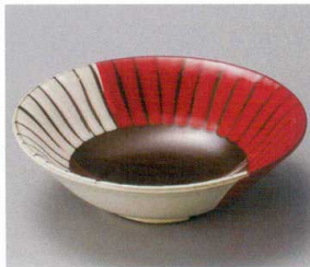
04808-281 紅白十草向付 2,900円 (16.5×5.5cm)