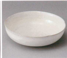
04814-301 京唐津梅型盛鉢 2,900円 (18.5×5.7cm)