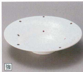
04806-131 淡雪向付 2,940円 (18×4cm)