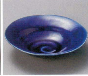
04820-451 紺勾玉平鉢 2,880円 (19.3×5.4cm)