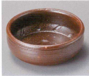
04803-181 灰吹ソギ4.5丸鉢 2,970円 (14.5×5.3cm)