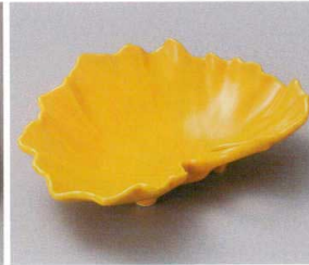
04815-541 黄釉木の葉向付 3,100円 (18×13.5×5.5cm)