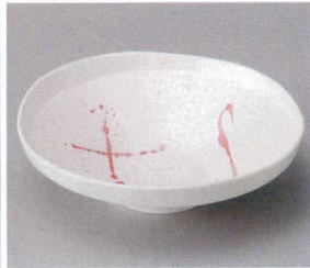
04812-011 赤散ラスター5.5たわみ鉢 2,900円 (16.5×16.3×4.5cm)