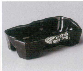
04807-181 黒織部長角小鉢 3,500円 (16×8.3×4cm)