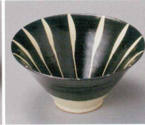
04818-101 黒十草反り鉢 3,400円 (16.3×8.1cm)