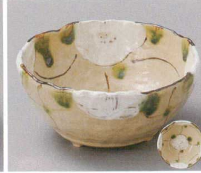
04819-521 格子花三ツ足5.0鉢 3,200円 (15.3×7cm)