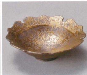
04810-101 ブロンズ金彩葉型小鉢 3,100円 (15×5cm)