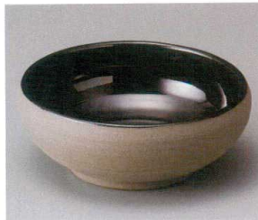
04801-181 アメ釉 南蛮5.3ボール 2,980円 (16.5×6.2cm)