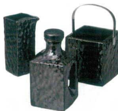
49625-241 雅ブラックピッチャー 3,400円 (7.4×7.7×17.2cm・550cc)