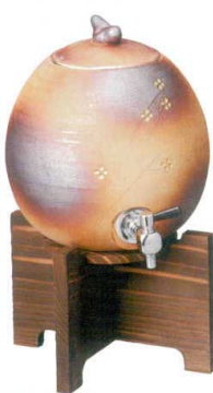
49610-431 火色小花焼酎サーバー 25,000円 (19.5×23×34cm・3000cc)