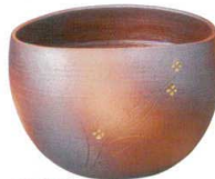
49619-431 火色小花ワインクーラー 9,000円 (25×20×14cm)