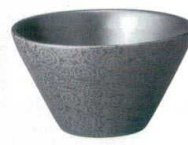
49620-101 銀彩唐草(黒)アイスベール 4,500円 (22.2×12.5cm)