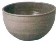
49618-431 黒焼メ大鉢(ワインクーラー) 12,500円 (21×12.5cm)