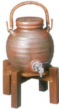
49611-431 灰釉手付焼酎サーバー (ラジウム入り) 焼杉台付 24,000円 (15×20×37cm・2,500cc) (信楽焼)