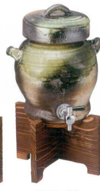
49609-431 ビードロサーバー 26,000円 (22×21×35cm) (信楽焼)