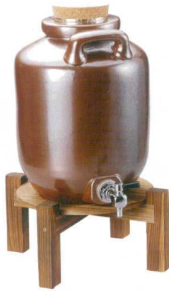
49601-121 茶耳付サーバー-2升 24,000円 (18.5×26.5cm・5750cc)