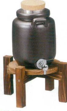
49613-121 黒耳付サーバー-1升 19,000円 (15×15×19cm・2600cc)