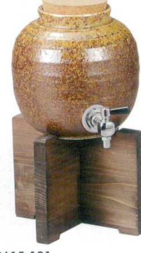
49615-101 信楽風丸一升サーバー(木台付) 18,000円 (16.8×17.8cm・2400cc)