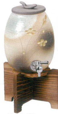
49608-431 金彩花彫サーバー 25,000円 (21.5×16×35cm・2200cc) (信楽焼)