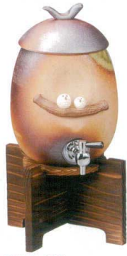
49612-431 ペアふくろうサーバー (焼杉台付) 22,500円 (16×21×36cm・2200cc)