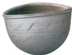
49617-431 炭化ワインクーラー 12,800円 (18.5×30×17.5cm)