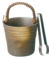
49631-101 黒備前アイスベール 2,800円 (12.6×11.8cm)