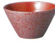
49621-101 銀彩唐草(赤)アイスベール 4,500円 (22.2×12.5cm)