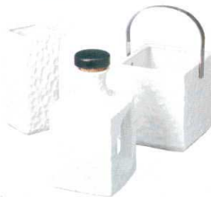
49622-241 雅ホワイトピッチャー 3,400円 (7.4×7.7×17.2cm・550cc)