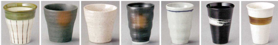
50120-321 織部サビ十草焼耐 1,090円 (9.3×10.2cm・350cc) 50121-341 黒伊賀焼耐カップ(小) 1,000円 (9.2×9.3cm・330cc) 50122-341 うのふ焼耐カップ(小) 1,000円 (9.2×9.3cm・330cc) 50123-511 黒備前焼耐カップ 1,000円 (8.8×12cm・360cc) 50124-511 灰貫入ライン焼耐カップ 1,000円 (8.8×12.3cm・360cc) 50125-151 黒白ハケフリーカップ 1,200円 (8.6×11.8cm) 50126-151 白錆ハケフリーカップ 1,200円 (8.6×11.8cm)