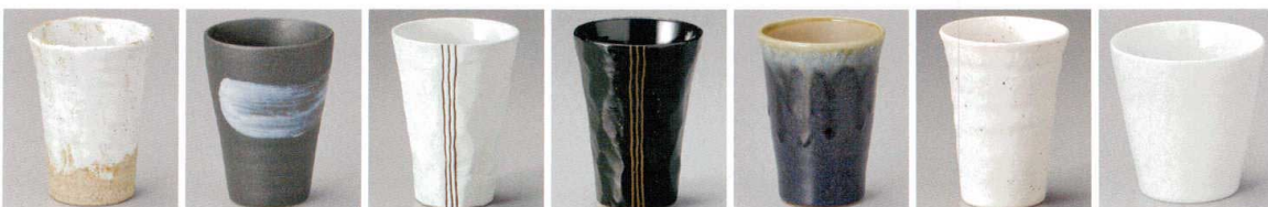
50141-151 粉引志野フリーカップ(中) 900円 (7.5×10cm) 50142-331 黒伊賀フリーカップ大 850円 (7.6×10.5cm) 50143-641 モダン白手折焼耐カップ 800円 (8.5×11.8cm・300cc) 50144-641 モダン黒手折焼耐カップ 800円 (8.5×11.8cm・300cc) 50145-121 さざなみフリーカップ 820円 (8.2×11cm・270cc) 50146-651 白たたきゴブレット 750円 (8.4×11.2cm・270cc) 50147-051 白磁フリーカップ(小) 730円 (7×7cm・160cc)