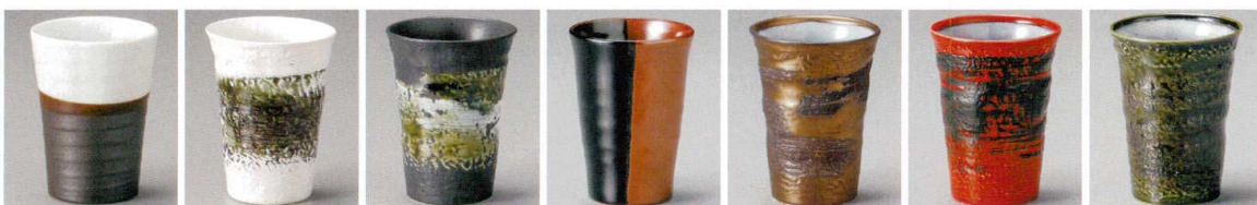
50134-651 茶掛フリーカップ(大) 900円 (8.3×11.2cm・280cc) 50135-491 白釉ハケメフリーカップ 880円 (8.3×11cm・280cc) 50136-491 黒釉ハケメフリーカップ 880円 (8.3×11cm・280cc) 50137-581 赤釉天目フリーカップ 880円 (8×11cm・250cc) 50138-021 ゴールド刷毛目フリーカップ 820円 (8.2×11cm・260cc) 50139-021 赤釉刷毛目フリーカップ 820円 (8.2×11cm・260cc) 50140-021 織部刷毛目フリーカップ 820円 (8.2×11cm・260cc)