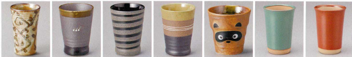
50101-491 たこ唐草フリーカップ 2,300円 (7.4×11.8cm・250cc) 50103-251 オークフリーカップ 中 1,320円 (7.9×10.4cm・250cc) 50105-251 黒ウスフリーカップ 中 1,320円 (8×10.4cm・260cc) 50107-251 黄系車フリーカップ 中 1,320円 (8×10.4cm・260cc) 50109-631 信楽たぬきフリーカップ(小) 1,250円 (8.8×9cm・250cc) 50111-121 グリーンフリーカップ 1,500円 (7.6×11cm・300cc) 50112-121 赤フリーカップ 1,500円 (7.6×11cm・300cc)