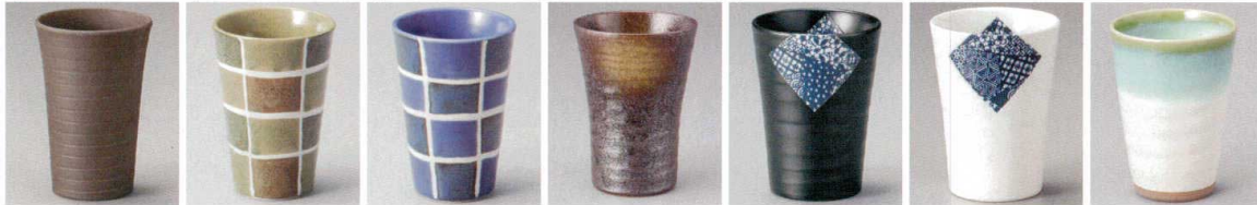
50113-651 ライン黒フリーカップ(大) 1,700円 (8×11.7cm・250cc) 50114-621 チェック ヨモギフリーカップ 1,200円 (7.8×11.3cm・250cc) 50115-621 チェック ルリナマコフリーカップ 1,200円 (7.8×11.3cm・250cc) 50116-031 吹油滴焼耐コップ 1,200円 (8.8×12cm) 50117-341 黒マツ角古紋六兵フリーカップ 1,200円 (8.3×11.3cm・300cc) 50118-341 白マツ角古紋六兵フリーカップ 1,200円 (8.3×11.3cm・300cc) 50119-321 淡緑彩フリーカップ 1,220円 (7.9×11cm)