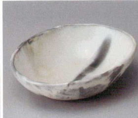
05210-431 白化粧ぼかし楕円鉢 2,480円 (17.5×13.5×4.5cm)