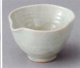
05212-311 うすみどり片口鉢 2,440円 (14.5×13.5×9cm)