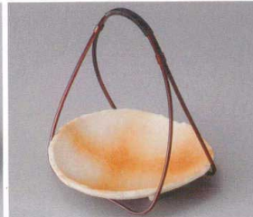
05218-181 栃塗ワンタッチ 持ち手(大) 2,050円 (14.3×20.2cm)