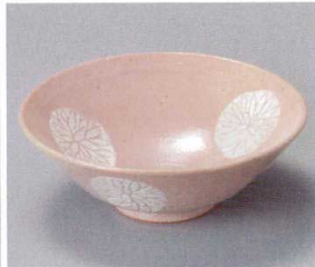
05208-451 花見平小鉢 2,500円 (14.7×5cm)