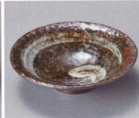
05216-241 渦潮5.5平鉢 2,400円 (17×4.5cm)