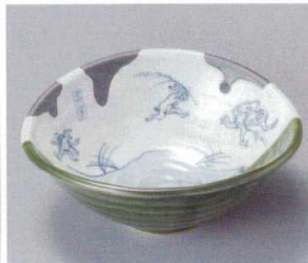
05207-121 染分鳥獸戯画たわみ鉢 2,500円 (15.5×13.8×5.9cm)