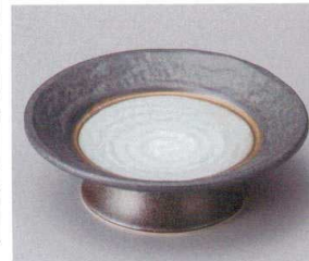
05217-051 ゴールドライン高台5.0皿 2,400円 (16×5.2cm)