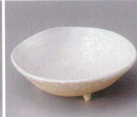
05220-321 白吹雪片押5.0鉢 2,360円 (14.8×12.8×5.3cm)