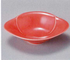
05203-081 赤釉玉椿浅広18鉢 2,500円 (18×15.5×4.5cm)