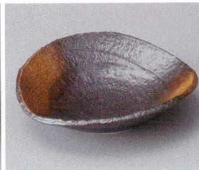
05214-251 黒備前扇鉢 2,500円 (21.5×19×5.5cm)