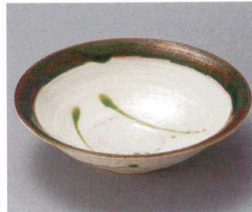
05209-121 内白織部丸中鉢 2,500円 (17.2×5.1cm)