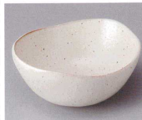
05213-081 オルジエデリカ18cm漬物鉢 2,750円 (17.5×14.5×7.4cm)