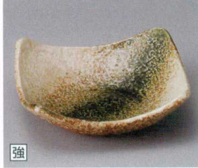
05204-151 緑川ひし形7.0鉢 2,500円 (21.1×19.7×5.5cm)