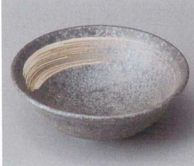
05202-431 黒窯変刷毛目5.0鉢 3,000円 (15×5.5cm) (信楽焼)