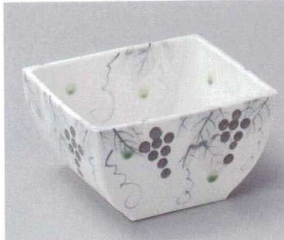
05201-521 白志野ぶどうマルチ角井 2,500円 (14.8×12.3×8.2cm)