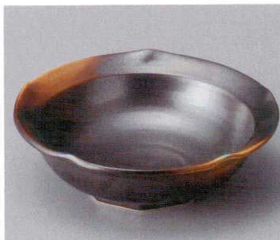
05206-251 やきしめ梅型4.8鉢 2,750円 (14.5×4.8cm)