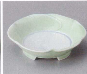
05215-181 若草多菜鉢 2,400円 (15×4.3cm)