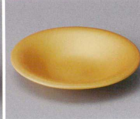
05221-401 総金彩五寸向付 2,500円 (16×3cm)