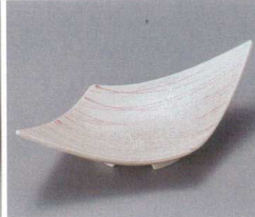
05211-181 ピンク珍ラスター菱形兩上り鉢 2,600円 (21.2×12×5.5cm)