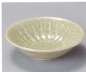
05205-031 かいらぎ緑釉向付 2,500円 (15.6×4.9cm)