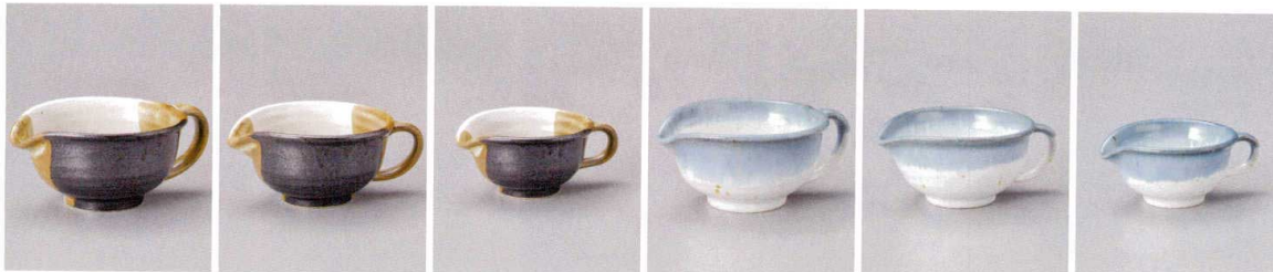
52501-281 茶塗り分ドレッシング鉢(大) 2,400円 (15.5×12×6.5cm) 52502-281 茶塗り分ドレッシング鉢(中) 1,800円 (14×10×6cm) 52503-281 茶塗り分ドレッシング鉢(小) 1,240円 (12×9×5cm) 52504-281 均窯ドレッシング鉢(大) 2,400円 (15.5×12×6.5cm) 52505-281 均窯ドレッシング鉢(中) 1,800円 (14×10×6cm) 52506-281 均窯ドレッシング鉢(小) 1,240円 (12×9×5cm)