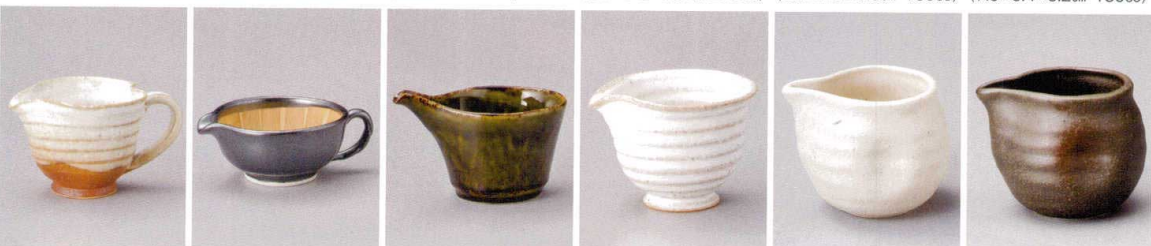
52513-431 チタン掛け分けドレッシングピッチャー 2,250円 (10.5×7.5×6.5cm) 52514-321 黒釉ドレッシング鉢(小) 1,130円 (12×10.3×5cm) 52515-251 匠織部片口ドレッシング 2,000円 (14×9.3×9cm・320cc) 52516-431 チタンドレッシングピッチャー 2,000円 (7×8.5×6cm) 52517-461 粉引釉変形汁次(ミニ) 1,650円 (9×7.5×7cm・210cc) 52518-461 備前風変形汁次(ミニ) 1,650円 (9×7.5×7cm・210cc)