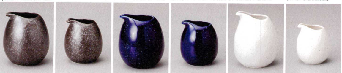
52526-601 銀黒ドレッシング大 1,700円 (8.3×10.2cm・300cc) 52528-601 銀黒ドレッシング小 1,320円 (6×7.4cm・110cc) 52529-601 夜空ドレッシング大 1,750円 (8.3×10.2cm・300cc) 52531-601 夜空ドレッシング小 1,380円 (6×7.4cm・110cc) 52532-601 白備前ドレッシング大 1,700円 (8.3×10.2cm・300cc) 52534-601 白備前ドレッシング小 1,380円 (6×7.4cm・110cc)