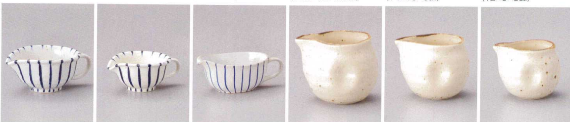
52507-031 ゴス十草ドレッシング(大) 2,400円 (12×10.2×5.6cm) 52508-031 ゴス十草ドレッシング(小) 1,600円 (10×8.7×4.8cm) 52509-281 粉引十草ドレッシング 1,570円 (14.5×8×4.5cm) 52510-101 粉引測サビ汁次(小) 1,900円 (9.7×7.8×7.7cm・250cc) 52511-101 粉引測サビ汁次(ミニ) 1,650円 (8.9×7.3×6.8cm・180cc) 52512-101 粉引測サビ汁次(マイクロ) 1,400円 (7.9×6.4×6.2cm・150cc)