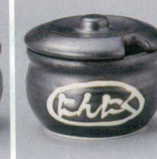
52629-101 カメ型にんにく入(黒) 1,400円 (5×4cm)