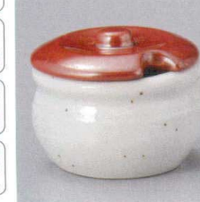
52626-101 梨地カメ型薬味入れ 1,400円 (5×4cm)