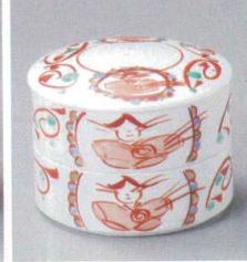
52606-651 手描雅1段重(M) 3,000円 (11.5×5cm・200cc)