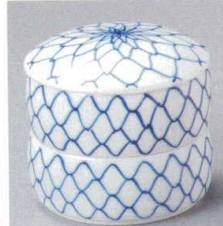
52608-341 アミ二段蓋物(小) 3,250円 (7×6.2cm)