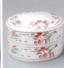
52604-651 手描花鳥1段重(L) 4,050円 (14.5×5.5cm・330cc)