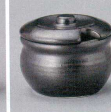
52627-101 黒マットカメ型薬味入れ 1,400円 (5×4cm)