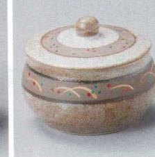
52625-491 むさしの蓋物 1,800円 (10×8cm)