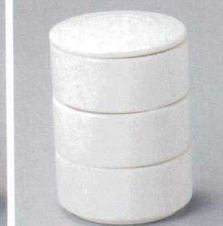
52618-461 ニューボン乳白 丸形三段重(小) 3,300円 (7.5×10.5cm)