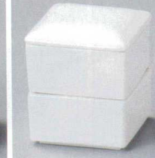
52623-291 白角二段重 2,200円 (7×8cm)