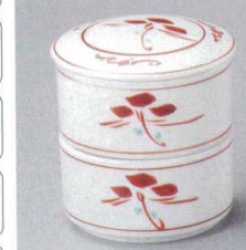
52621-651 手描小花二段重(SS) 3,000円 (8×8.5cm)