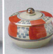
52624-491 市松蓋物 1,800円 (10×8cm)