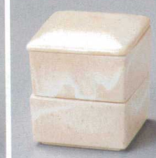
52619-291 志野角二段重 2,200円 (7×8cm)