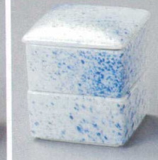
52620-291 吹墨角二段重 3,150円 (7×8cm)