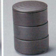
52615-461 黒ガラス丸形三段重(小) 3,300円 (7.5×10.5cm)