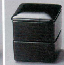
52622-291 黒角二段重 2,650円 (7×8cm)