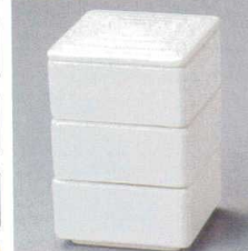
52616-461 ニューボン乳白 角形三段重(小) 3,300円 (7×7×10.5cm)