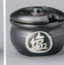
52628-101 カメ型塩入れ(黒) 1,400円 (5×4cm)