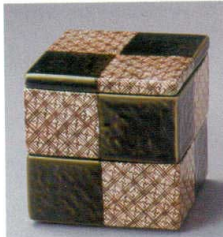
52601-461 格子織部二段重 14,600円 (12.1×12.1×12.5cm)