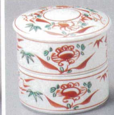
52610-651 手描花鳥1段重(S) 2,800円 (10×5cm・150cc)