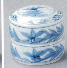
52613-341 桔梗二段蓋物(小) 3,100円 (7×6.2cm)