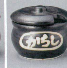
52630-101 カメ型からし入(黒) 1,400円 (5×4cm)