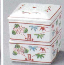
52612-341 手描き菊笹角二段重 4,200円 (7×7×8.3cm)