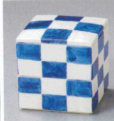
52602-461 青市松二段重(小) 10,600円 (11.5×11.5×12cm)