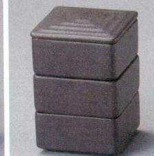
52617-461 黒ガラス 角形三段重(小) 3,300円 (7×7×10.5cm)