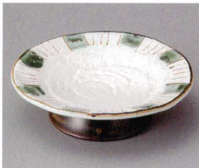
05309-031 織部十草高台5.0皿 2,300円 (16.3×4.5cm)