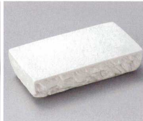
05302-541 SMA岩石長角プレート 2,300円 (15.5×8×4cm)