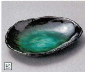
05301-461 新緑ビードロ7.0変形刺身鉢 2,350円 (20×16×3.5cm)