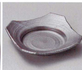
05307-601 南蛮角向付 2,300円 (17×3.8cm)