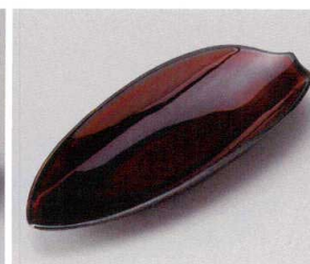
05308-33-511 うるしブラウンす長皿(大) 2,500円 (27×10.5×3.4cm)