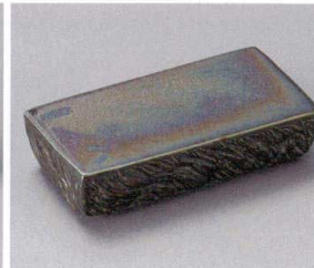
05303-541 SVA岩石長角プレート 2,300円 (15.5×8×4cm)