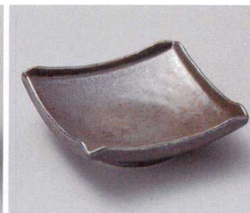
05312-541 金結晶 正角向付 2,300円 (14×14×4.5cm)