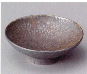
05313-05-471 金結晶高台向付 2,580円 (16×5.8cm)