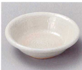
05314-461 荒土御本手 5.5鉢 2,300円 (16×5cm)