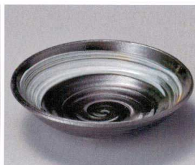
05306-221 黒陶吹刷毛目6.0鉢 2,300円 (18.8×5cm)