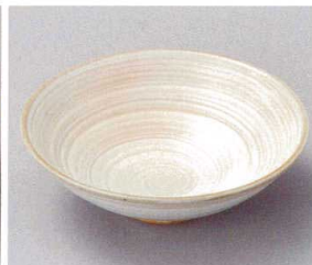
05311-461 粉引刷毛目5.0平鉢 2,300円 (14.5×5cm)