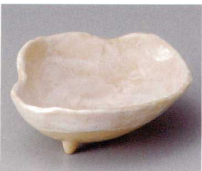
05317-311 手造り風志野三つ足向付 2,260円 (16.8×13.5×7cm)