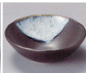
05316-311 融雪丸盛鉢 (中) 2,280円 (15.7×5.4cm)