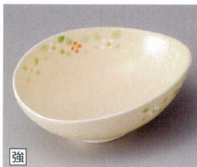
05305-151 ベージュ小花楕円ボール 2,300円 (16×12.4×5.7cm)