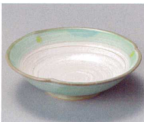
05318-181 新緑(土物)平向付 2,250円 (15.8×4.5cm)