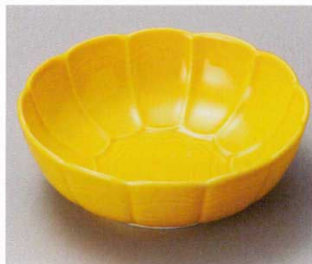
05310-121 黄菊形カゴメ鉢 2,300円 (14×4.7cm)