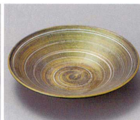
05320-401 黒御影緑金彩6寸鉢 2,300円 (18×3.7cm)