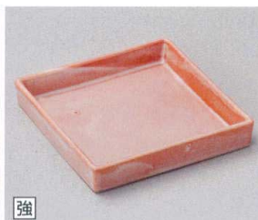
05319-291 赤楽切立皿 2,250円 (15×15×2.6cm)