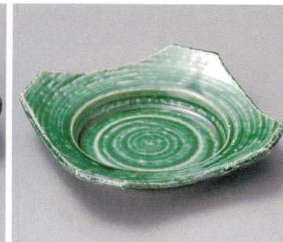
05304-601 織部角向付 2,300円 (17×3.8cm)