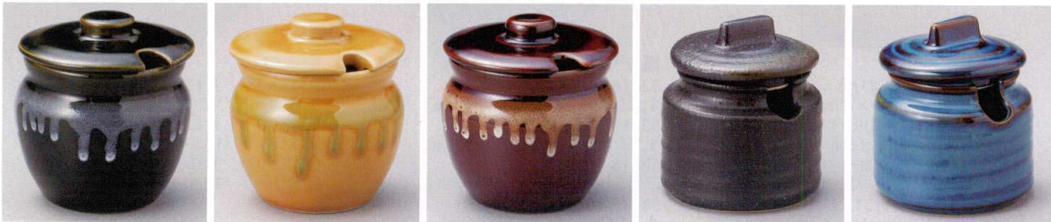
53311-581 織部白流し蓋切2号葉味入 950円 (9×10cm・260cc) 53312-581 黄織部流し蓋切2号葉味入 950円 (9×10cm・260cc) 53313-581 アメ白流し蓋切2号葉味入 950円 (9×10cm・260cc) 53314-601 黒マット瓶型口切フタ物 1,000円 (8.3×9.5cm・250cc) 53315-601 ナマコ瓶型口切フタ物 1,000円 (8.3×9.5cm・250cc)