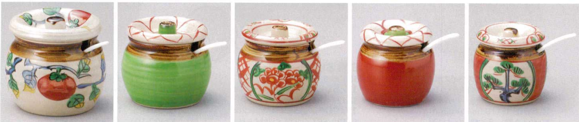
53316-101 錦柿サジ付2合ツボ 2,600円 (9.5×8.5cm・290cc) 53317-101 花紋サジ付1合ツボ(緑) 2,200円 (8.2×7.5cm・160cc) 53318-101 間取花サジ付1合ツボ 2,200円 (8.2×7.5cm・160cc) 53319-101 花紋サジ付ミニツボ(赤) 1,800円 (6.5×7cm・120cc) 53320-101 錦松竹梅サジ付ミニツボ 1,800円 (6.5×7cm・120cc)