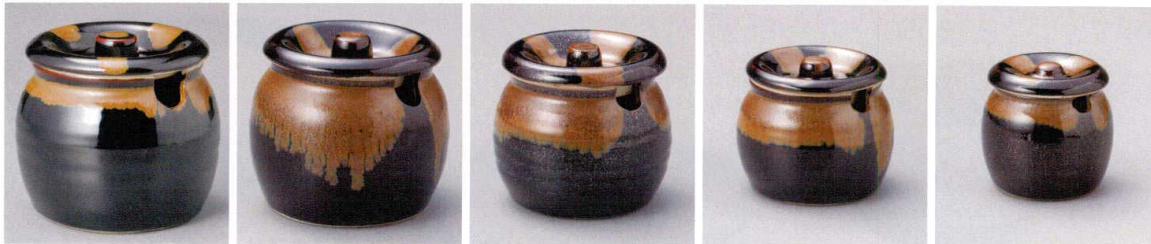
53301-201 黒切込4号カメ 2,000円 (12×11cm・600cc) 53302-101 天目3号ツボカット付 1,250円 (11×9.5cm・410cc) 53303-101 天目2号ツボカット付 950円 (9.5×8.5cm・290cc) 53304-101 天目1号ツボカット付 800円 (7.5×7.3cm・160cc) 53305-101 天目ミニツボカット付 680円 (6.5×6.7cm・120cc)