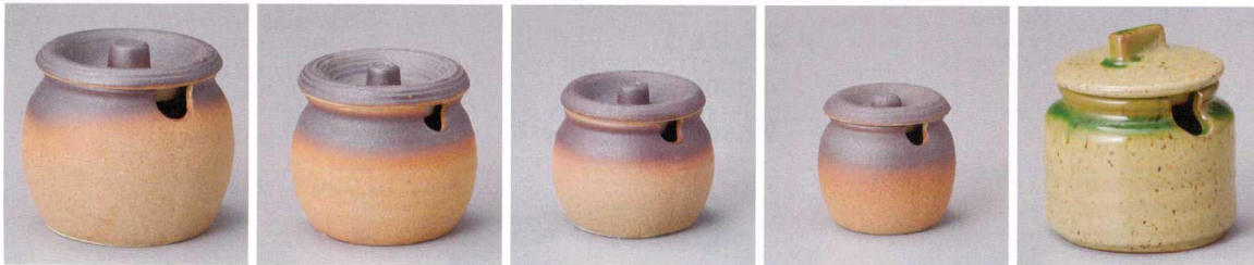
53306-101 伊賀吹3合ツボカット付 1,250円 (11×9.5cm・410cc) 53307-101 伊賀吹2合ツボカット付 950円 (9.5×8.5cm・290cc) 53308-101 伊賀吹1合ツボカット付 800円 (7.5×7.3cm・160cc) 53309-101 伊賀吹ミニツボカット付 680円 (6.5×6.7cm・120cc) 53310-051 黄瀬戸ビードロ口切込み蓋物 1,300円 (8.3×9cm・200cc)