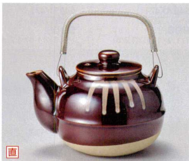
53915-581 アメ鈴型薬土瓶5号 3,300円 (14×13cm・1100cc)