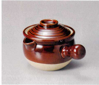
53902-101 行平(中) 2,500円 (21×15×12.5cm・900cc)