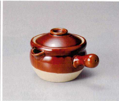
53903-101 行平(小) 2,200円 (19×13.5×10.5cm・700cc)