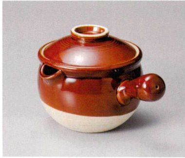
53901-101 行平(大) 2,800円 (22.3×15.5×13.5cm・1200cc)