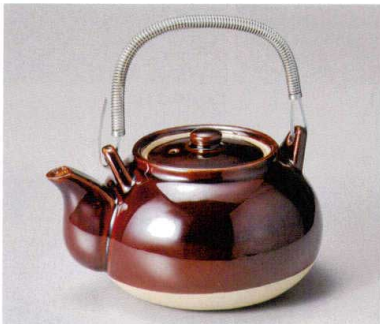
53907-10-581 アメ栗型薬土瓶8号 3,600円 (20×16×12cm・1400cc)