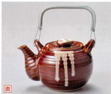
53910-611 アメ白流し6.0薬用土瓶 2,700円 (19×12.5×12.5cm・1200cc)