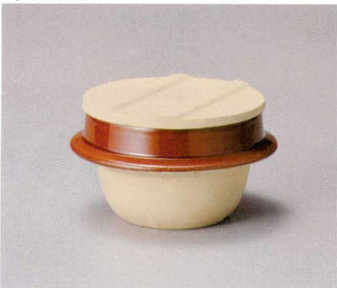
53911-10-581 釜飯 600円 (14×11.5×8cm・500cc)