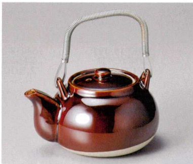
53909-10-581 アメ栗型薬土瓶5号 3,300円 (19×14.5×10.8cm・1150cc)