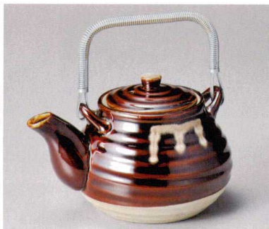
53905-101 茶流し8号土瓶 3,600円 (21×16.5×H14cm・1500cc)