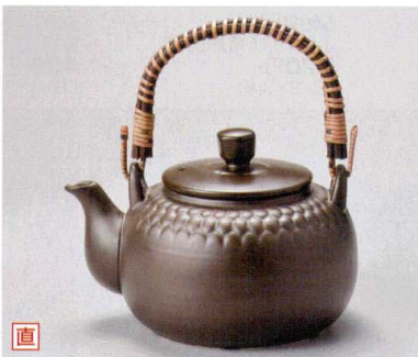
53912-711 ダルマ土瓶(超耐熱)1200cc 7,300円 (15×12.5cm・1200cc)