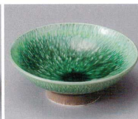
05418-10-471 緑釉黄流とちり高台向付 2,200円 (16×6cm)