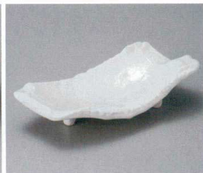
05412-181 アイランドちぎり長角8.0皿 2,200円 (25×13×5.8cm)