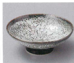
05417-541 白柚子天目トチリ高台向付 2,300円 (16×6cm)