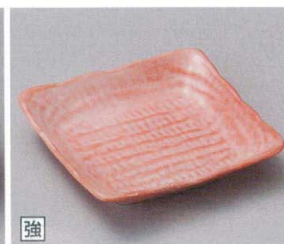
05419-291 赤染正角皿 2,100円 (17.5×3.5cm)