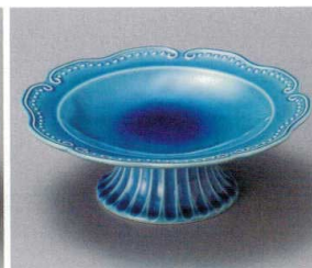
05415-181 トルコ釉16cm高台皿 2,250円 (15.7×5.2cm)