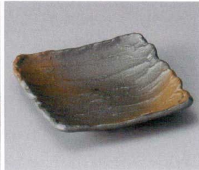
05404-281 黒伊賀茶吹荒ソギ17cm中鉢 2,200円 (17×4cm)