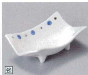
05410-451 二色水玉向付 2,200円 (17.5×10.5×6cm)