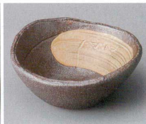
05408-431 黒泥刷毛目中鉢 2,200円 (14×6cm) (信楽焼)