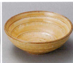
05414-121 かいらぎ向付 2,700円 (17.3×4.3cm)