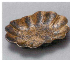
05413-541 炭金菊割楕円皿 2,200円 (18×13.2×3.2cm)