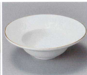
05407-081 測金白マツリムボール(小) 2,200円 (15.3×4.8cm)