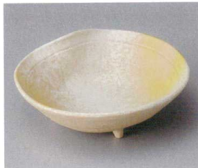
05401-321 山吹片押5.0鉢 2,250円 (14.8×13×5.2cm)