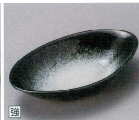
05411-131 雲海7.0小判鉢 2,180円 (21.3×12.8×4cm)