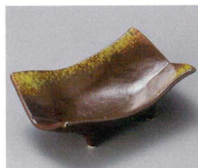
05409-451 信楽吹向付 2,200円 (17.5×10.5×6cm)