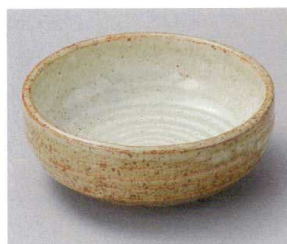
05405-461 石焼かいらぎ5.0ボール 2,200円 (16×6cm)