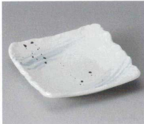
05402-281 涼風17cm中鉢 2,200円 (17×4cm)