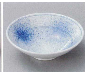
05420-471 吹墨5.0鉢 2,100円 (16×5cm)