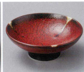
05416-541 紅柚子天目トチリ高台向付 2,300円 (16×6cm)