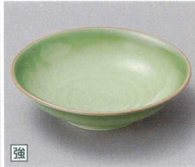
05403-451 緑彩向付 2,200円 (15.5×4.2cm)