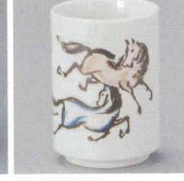
54629-301 福よぶ左馬寿司湯呑 800円 (7.2×10cm)