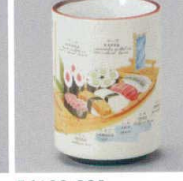
54630-221 クリームアラカト(中)湯呑 850円 (7.4×10.1cm・240cc)