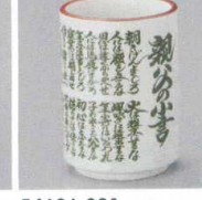
54636-081 親父の小言中寿司湯呑 680円 (7.2×10.2cm・280cc)