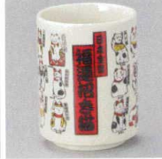
54620-25-621 招き猫寿司湯呑 880円 (7.2×10.3cm)