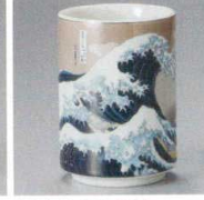
54623-25-621 波富士寿司湯呑 880円 (7.3×10.5cm)