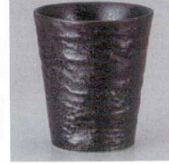
54631-541 黒石目寿司湯呑 650円 (8.6×10cm)