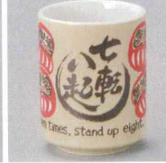
54611-411 七転八起中切立湯呑 1,100円 (7.3×9.4cm)