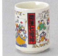
54619-25-621 開運七福神寿司湯呑 880円 (7.6×10.3cm)