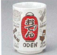
54607-411 おでん中切立湯呑 1,100円 (7.2×10.3cm)