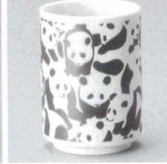
54616-291 バンダ中切立湯呑 1,100円 (7.2×10.3cm)