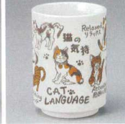
54606-411 猫の気持ち中切立湯呑 1,100円 (7.2×10.3cm)