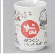
54612-411 福づくし中切立湯呑 1,100円 (7.2×10.3cm)