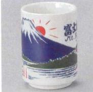
54608-411 富士山中切立湯呑 1,100円 (7.2×10.3cm)