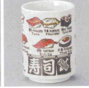
54626-41-541 すしねた中切立湯呑 860円 (7.2×10.3cm)