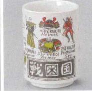
54610-411 戦国英語中切立湯呑 1,100円 (7.2×10.3cm)