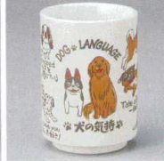
54605-411 犬の気持ち中切立湯呑 1,100円 (7.2×10.3cm)