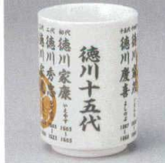
54604-411 徳川十五代中切立湯呑 1,100円 (7.2×10.3cm)