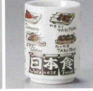
54627-541 日本食切立カラー-中寿司 860円 (7.2×10.2cm)