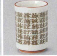
54617-331 切立大魚へん寿司湯呑 900円 (7.6×11.1cm)