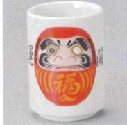
54614-051 新ダルマ湯呑(大) 980円 (7.3×10.3cm・320cc)