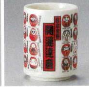
54621-621 ダルマ寿司湯呑 880円 (7.5×10.5cm)