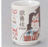
54609-411 歌舞伎(松丸)中切立湯呑 1,100円 (7.2×10.3cm)