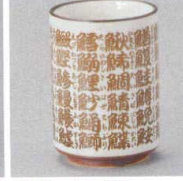
54632-33-601 魚文字寿司湯呑 820円 (7.2×10cm)