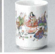
54624-531 七福神寿司湯呑 850円 (7.6×10.5cm・275cc)