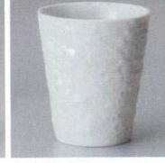
54628-541 白石目寿司湯呑 550円 (8.6×10cm)