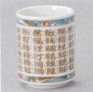
54602-051 カラ-魚字湯呑 1,100円 (7.2×9.5cm・260cc)