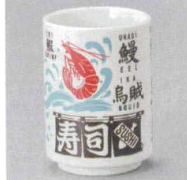
54613-411 魚字英語中切立湯呑 1,100円 (7.2×10.3cm)