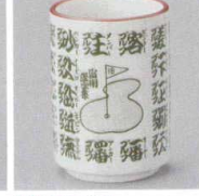
54633-081 ゴルフ湯呑 680円 (7.1×10.2cm・280cc)