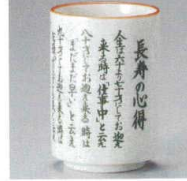
54625-631 長寿の心得寿司湯呑 880円 (7×10.3cm)