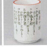
54634-081 梨地健康十訓湯呑(中) 680円 (7.1×10.2cm・280cc)