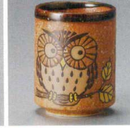
54618-631 伊賀ふくろう寿司湯呑 880円 (7.2×9.2cm)