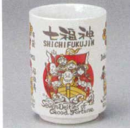
54603-411 七福神中切立湯呑 1,100円 (7.2×10.3cm)