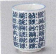
54601-08-631 布目魚字角寿司湯呑 1,350円 (7.7×9.8cm・290cc)