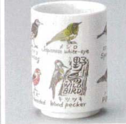
54615-291 野鳥中切立湯呑 1,100円 (7.2×10.3cm)