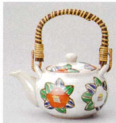
58521-341 山茶花3号土瓶 3,300円 (11×10.5cm・450cc)