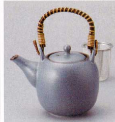
58503-461 アッシュ(グレー)つるつる土瓶 5,700円 (10×11.5cm・540cc)