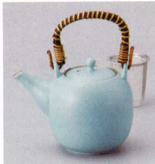
58501-461 ソーダつるつる土瓶(茶コシ付) 5,700円 (10×11.5cm・540cc)