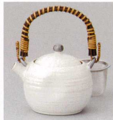
58522-541 白伊賀玉土瓶(アミ付) 3,250円 (9×9cm・230cc)