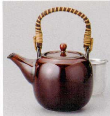
58502-601 うるし釉土瓶(アミ付) 5,500円 (10.5×11.5cm・500cc)