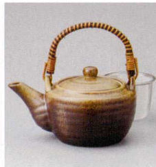
58507-581 備前風8号土瓶(アミ付) 5,200円 (16×12cm・1500cc)