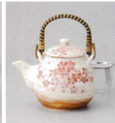
58515-601 平安桜土瓶(アミ付) 4,800円 (11.5×14cm・770cc)