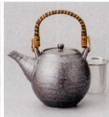
58508-601 銀黒土瓶アミ付 5,100円 (16×10.3×11.3cm・530cc)