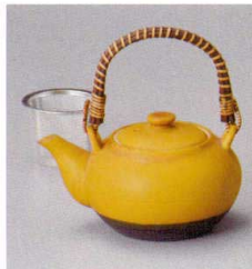
58506-451 満月土瓶 5,200円 (17×13.5×17cm・600cc)