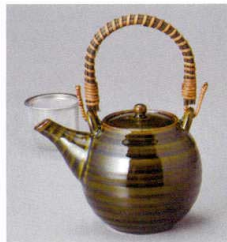
58516-121 深緑土瓶 5,000円 (14.2×10.5×11cm・560cc)