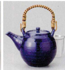
58510-601 夜空土瓶 アミ付 5,100円 (16×10.3×11.3cm・530cc)