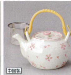
58524-331 さくら淡雪4号土瓶 2,600円 (720cc)