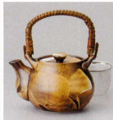
58512-641 黄昏4号土瓶(アミ付) 4,900円 (16×13×10cm・750cc)U茶こし付