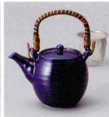
58513-601 夜空土瓶(小) 5,000円 (13.5×19.4×10.1cm・350cc)