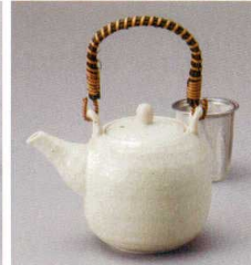
58504-461 粉引釉(アミ・つる付)土瓶 5,400円 (10×11.5cm・540cc)