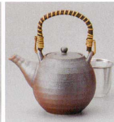
58509-601 黒信楽土瓶 アミ付 5,200円 (16×10.3×11.3cm)