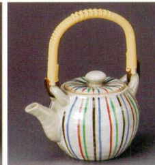
58519-331 十草豆土瓶 3,300円 (360cc)