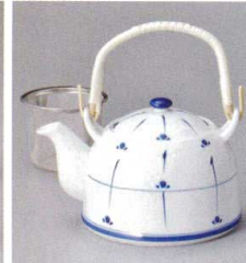
58505-241 新芽土瓶8号茶こし付 5,300円 (1,100cc)