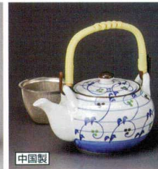
58525-331 つる木の実BA4号土瓶 2,300円 (540cc)