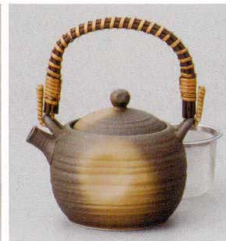
58523-541 黒伊賀玉土瓶(アミ付) 3,250円 (9×9cm・230cc)