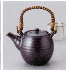
58514-601 漆黒土瓶(小) 5,000円 (13.5×19.4×10.1cm・350cc)