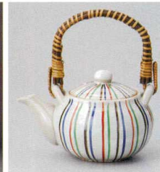
58520-341 十草3号土瓶 3,300円 (11×10.5cm・450cc)