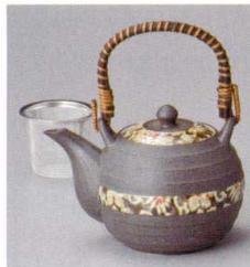
58511-451 色唐草千段土瓶 5,400円 (16×12×11cm・680cc)