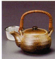
58517-10-631 備前風4号土瓶(アミ付) 3,600円 (18.5×14×11cm・800cc)