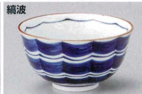
縞波 60722-081 ぶっかけ丼小井 790円 (13.2×7.5cm) 60723-081 ぶっかけ丼 1,140円 (16.2×8.8cm)