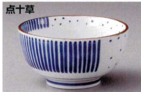
点十草 60718-081 4.0京井 780円 (13×8cm) 60719-081 5.0京井 1,180円 (15.5×8cm)