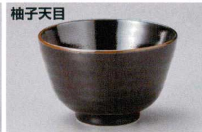
柚子天目 60724-281 なごみ丼小 580円 (11.5×7.2cm) 60725-281 なごみ丼大 1,060円 (14.2×9.5cm)