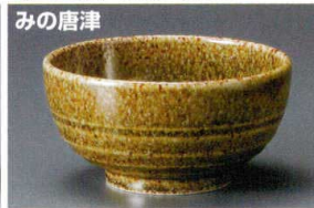
みの唐津 60713-671 4.0京井 800円 (12.8×6.1cm) 60714-671 4.5京井 900円 (14×7.1cm) 60715-671 5.0京井 1,020円 (15.6×8cm)