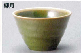
柳月 60728-021 多用碗 小 850円 (11.1×7cm) 60729-021 多用碗 ミニ 750円 (9.3×6.6cm)