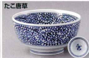
たご唐草 60720-081 4.0京井 780円 (13×8cm) 60721-08-531 5.0京井 1,150円 (15.5×8cm)