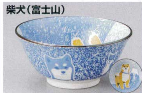
柴犬(富士山) 60737-611 4.0多用丼 600円 (13×6.7cm) 60738-611 4.8多用丼 650円 (14.7×6.7cm)