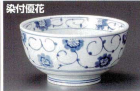
染付優花 60703-531 4.0京井 780円 (13×7.8cm) 60704-531 5.0京井 1,150円 (15.3×8cm)