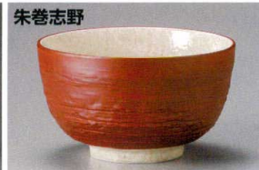
朱巻志野 60732-641 4.1口クロ目井 750円 (12.6×7cm) 60733-641 4.6口クロ目井 850円 (14.3×8.4cm)