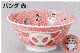
パンダ赤 60743-611 4.0多用丼 600円 (13.3×6.8cm) 60744-611 4.8多用丼 650円 (15.2×7.2cm)