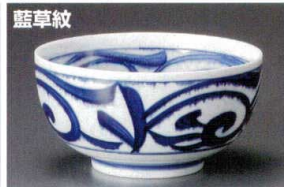
藍草紋 60730-491 お好み丼(小) 800円 (13.2×7.2cm) 60731-491 お好み丼(大) 1,050円 (16×8.2cm)