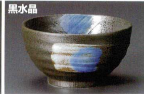
黒水晶 60707-531 4.0お好み碗 780円 (13×8cm) 60708-531 5.0お好み碗 1,150円 (15×8.3cm)