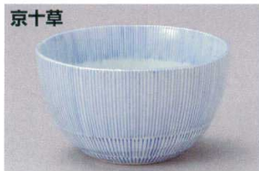
京十草 60734-071 3.5深鉢 440円 (11×6cm) 60735-071 4.0深鉢 510円 (12.5×7cm) 60736-071 4.8深鉢 800円 (14.8×8.5cm)