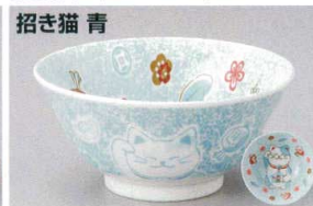
招き猫青 60749-611 4.0多用丼 600円 (13.3×6.8cm) 60750-611 4.8多用丼 650円 (15.2×7.2cm)