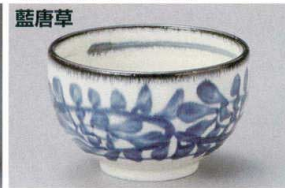
藍唐草 60716-081 4.0多用丼 820円 (12.5×7.5cm) 60717-081 4.2多用丼 1,050円 (13×8cm)