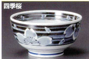
四季桜 60709-531 4.0京井 780円 (13×7.6cm) 60710-531 5.0京井 1,150円 (15.2×8cm)