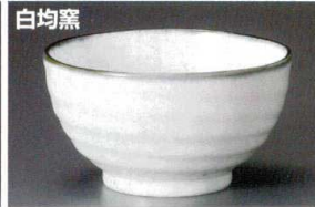
白均窯 60705-531 4.0お好み碗 780円 (13×8cm) 60706-531 5.0お好み碗 1,150円 (15.3×8.4cm)