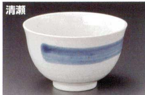
清瀬 60726-121 反茶碗 850円 (11.5×7.5cm) 60727-121 反たもり碗 980円 (13×8cm)