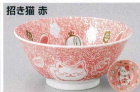
招き猫赤 60747-611 4.0多用丼 600円 (13.3×6.8cm) 60748-611 4.8多用丼 650円 (15.2×7.2cm)