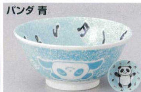
パンダ青 60745-611 4.0多用丼 600円 (13.3×6.8cm) 60746-611 4.8多用丼 650円 (15.2×7.2cm)