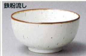
鉄粉流し 60711-251 お好み丼 小 840円 (13.2×7.4cm) 60712-251 お好み丼 大 1,100円 (16×8.4cm)