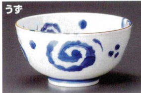
うず 60701-491 軽量丼(小) 830円 (13.3×7.3cm) 60702-491 軽量丼(大) 1,150円 (16×8.2cm)