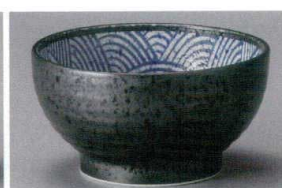
61019-631 青海波釜上井 2,200円 (17×8.8cm)