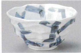
61008-181 タコ唐草八角大井 2,650円 (17×9cm)