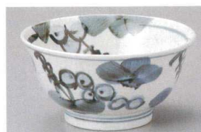
61013-301 水晶ぶどう5.5深口井 2,400円 (17.5×8.7cm)