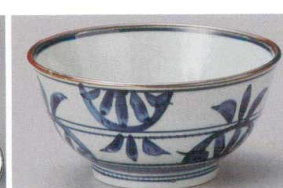
61022-051 トチリ笹5.5種井 2,100円 (17×8.5cm)