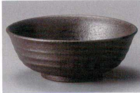
61002-061 露(黒)6.5反井 2,820円 (19.5×7.3cm)