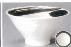
61020-491 白海流6.5薄筋高浜井 2,200円 (20×10cm・1100cc)