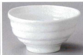
61010-641 白ろくろ目17.5cm井 2,560円 (17.5×9cm)