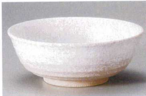
61001-061 露(白)6.5反井 2,820円 (19.5×7.3cm)