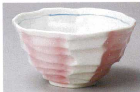
61005-181 ピンク吹き白ドット八角井 2,700円 (17×9cm)