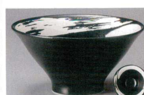
61021-491 黒海流6.5薄筋高浜井 2,200円 (20×10cm・1100cc)