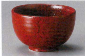
61007-021 赤結晶マグマ夏目4.8井 2,700円 (14.4×9cm)