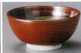
61015-021 赤釉織部目付6.0深口井 2,350円 (18×9cm)