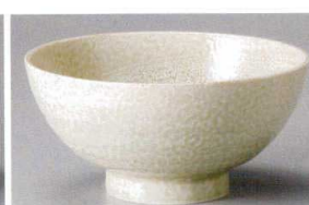
61018-601 グリンイラボ6.5めん井 2,220円 (19.8×9.6cm)