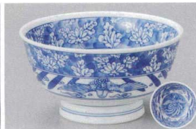
61012-331 花鳥5.5多用井 2,500円 (17.7×9.7cm)