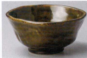
61006-251 匠織部手作り風中鉢 2,700円 (17.2×8.3cm)