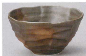
61009-181 黒伊賀備前吹八角大井 2,650円 (17×9cm)