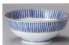
61017-531 すだれ十草うどん井(大) 2,270円 (20×8.2cm)