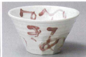
61011-181 春夏秋冬ケズリ大井 2,550円 (16.3×9.2cm)