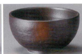
61023-641 備前風石目5.5多用井 2,050円 (17.5×9.5cm)