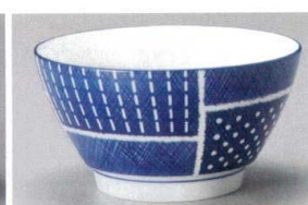
61024-641 古青藍藍格子 蕎麦井 2,000円 (17.4×9.2cm)