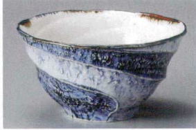
61004-541 呉須濃波彫5.5井 3,000円 (16.8×8.8cm)