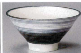
61014-491 古代おふけ6.5千段高浜井 2,400円 (20×10cm・1100cc)