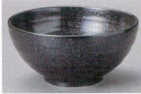
61003-201 燻し黒輪紋7.2特大井 2,800円 (21.6×10cm)