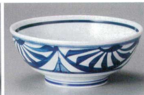
61016-531 風車うどん井(大) 2,270円 (20×7.2cm)