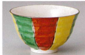
62105-491 手描き紙風船5.0丼 1,980円 (14.7×8.7cm)