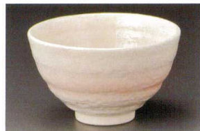
62117-401 桜志野多用丼 2,250円 (13.3×7.9cm)