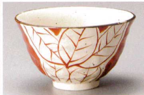
62106-18-491 手描き赤ダミ木の葉5.0丼 1,980円 (14.7×8.7cm)