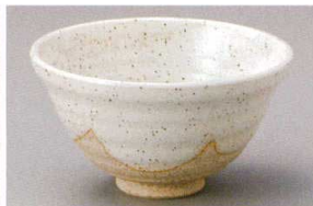
62122-131 晋釉手造り丼 1,840円 (14.5×14×7.5cm)