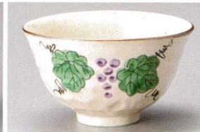
62104-491 手描きぶどう5.0丼 1,980円 (14.7×8.7cm)