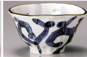
62108-021 染付唐草4.5多用碗 1,980円 (13.3×12.3×7.5cm)