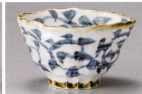
62120-021 たこ唐草4.5三ツ押丼 1,850円 (13.8×13.5×8cm)