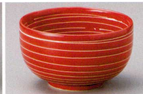
62124-491 ホワイハ輪花たまり碗 1,800円 (13.6×7.8cm)