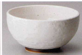
62123-181 粉引石目5.0丼 1,520円 (15.3×8cm)