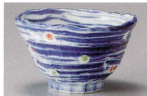
62121-021 刷毛目水玉4.5三ツ押丼 1,850円 (13.8×13.5×8cm)