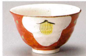
62109-491 手描き赤ダミ椿5.0丼 1,980円 (14.7×8.7cm)