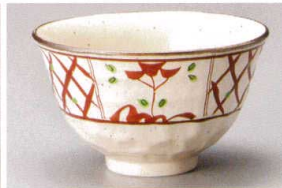
62107-491 手描き格子間取花5.0丼 1,980円 (14.7×8.7cm)