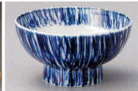
62116-541 藍十草高台丼 1,900円 (15.5×8cm)