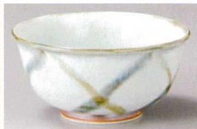
62118-151 オフケカゴ×5.0反丸丼 1,850円 (15.3×8cm)