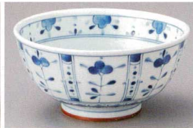
62103-051 凜立花5.5丼 2,200円 (16.5×8.2cm)