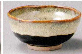
62112-151 うのふ天目ぬり分け多用丼(中) 1,920円 (15.1×7.4cm)