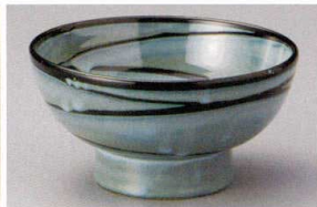
62114-541 黒雪舟高台丼 1,900円 (15.5×8cm)