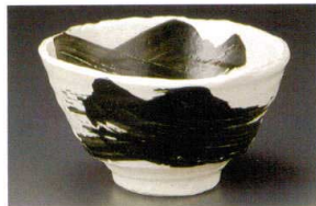
62101-161 黒刷毛4.5丼 2,190円 (14.2×8.2cm)