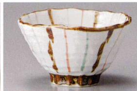
62119-021 三色段十草4.5三ツ押丼 1,850円 (13.8×13.5×8cm)