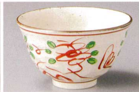
62111-011 手描 二輪花5寸丼 1,940円 (14.8×9cm)