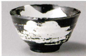
62102-161 白刷毛4.5多用丼 2,190円 (14.2×8.2cm)