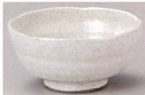
62110-321 岩白吹多用丼 1,960円 (15×7.2cm)