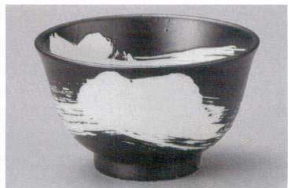
62224-081 刷毛巻黒かきこみ並丼 1,350円 (14.8×8.8cm)