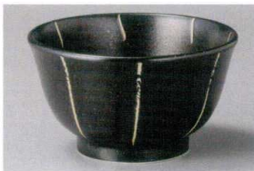
62219-281 クラフトライン(黒)かきこみ大丼 1,400円 (15.8×9cm)