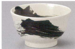
62209-081 刷毛巻白かきこみ大丼 1,550円 (15.7×8.9cm)