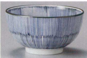
62222-601 三段クシメ5.0丼 1,370円 (15.8×8.4cm)