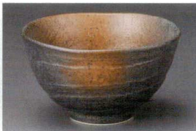
62215-081 黒備前吹き六兵衛めし丼 1,450円 (13.5×7.8cm)