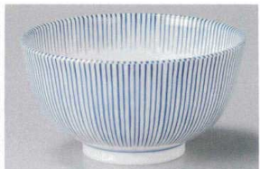
62216-33-601 内外京十草青軽量丼 1,450円 (15.6×8.4cm)