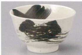
62223-081 刷毛巻白かきこみ並丼 1,350円 (14.8×8.8cm)