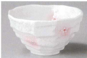
62211-181 ほのか削り八角丼 1,500円 (13.7×7.4cm)