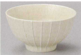
62218-331 ストライプ白灰マット5.0丼 1,400円 (16.4×8.4cm)