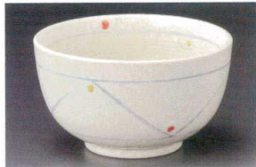
62201-331 三彩水玉4.5深ボール 1,800円 (13.5×8cm)