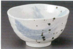
62203-281 涼風飯丼 1,700円 (13.7×7.8cm)