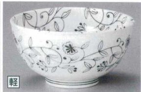
62204-601 夢の花青軽量丼 1,660円 (16×8.4cm)