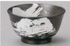
62210-081 刷毛巻黒かきこみ大丼 1,550円 (15.7×8.9cm)