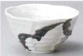
62206-231 染付呉須刷毛八角小丼 1,800円 (13×7.5cm)