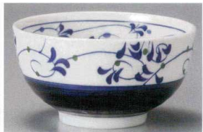
62212-601 土岐唐草青5.0丼 1,470円 (16×8.5cm)