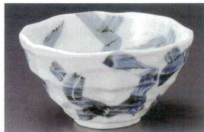
62213-181 染付タコ唐草ケズリ八角小丼 1,450円 (13.5×7.4cm)