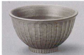
62205-251 ローマングレーしのご5.0丼 1,760円 (15.5×9cm)