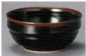
62220-491 ゆず天目5.5深鉢 1,380円 (17.8×7.7cm)