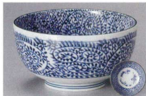
62217-141 たこ唐草多用丼 1,400円 (16×8.5cm)