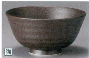
62208-461 黒南蛮 4.3多用丼 1,580円 (14×7cm)