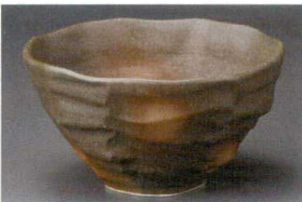
62214-181 黒備前吹きケズリ八角小丼 1,450円 (13.5×7.4cm)