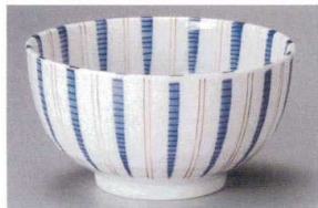
62221-601 千段十草青5.0丼 1,370円 (16×8.5cm)