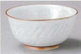
62202-151 口紅乳白5.0丸丼 1,760円 (15.5×8.2cm)