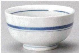
62207-471 布目呉須線多用丼(中) 1,600円 (15×8cm)