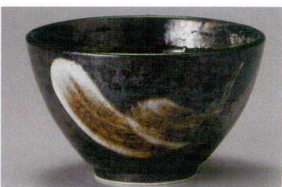
62412-611 明世荒刷毛手捨姫丼 900円 (13.3×8.2cm)