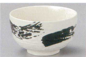
62424-081 極刷毛白ロ口目4.5丼 850円 (14.3×8.4cm)