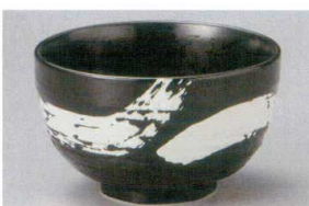
62423-081 極刷毛黒口ロ口目4.5丼 850円 (14.3×8.4cm)