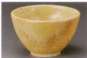
62410-231 野あそび手びねり4.5姫丼 900円 (13.3×8.2cm)