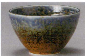
62415-611 砂地藍流し手捨姫丼 900円 (13.3×8.2cm)