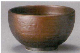
62407-641 備前風石目4.2多用丼 1,000円 (13.3×7.5cm)