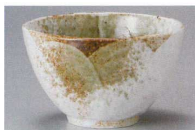
62417-611 雪志野手捨姫丼 900円 (13.3×8.2cm)