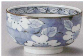
62406-621 山茶花大丼 960円 (15.5×8cm)