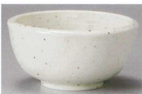
62419-611 ゆず肌クリーム括り手姫丼 900円 (13.8×7.2cm)