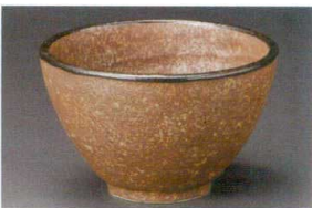
62408-281 アース手びねり姫丼 940円 (13.5×8.3cm)