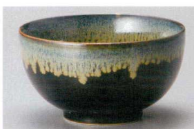
62422-491 天目白流しお好み丼(小) 860円 (13.2×7.4cm)