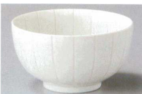
62404-161 十草(粉引)多用碗 970円 (13.2×7.5cm)