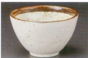
62411-231 粉引ライン手びねり4.5姫丼 900円 (13.3×8.2cm)