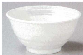
62409-401 ハケメ白雪5.0反種丼 1,480円 (15.5×8cm)