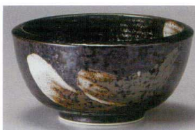
62418-611 明世荒刷毛括り手姫丼 900円 (13.8×7.2cm)