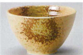
62416-611 信楽織部手捨姫丼 900円 (13.3×8.2cm)