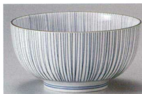
62401-631 細十草お好み丼(大) 980円 (16×8.5cm)