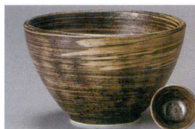
62413-611 至福(黒)手捨姫丼 900円 (13.3×8.2cm)