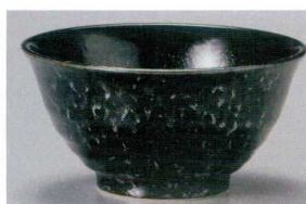
62421-641 黒真珠手引5.0反和丼 870円 (15.8×7.8cm)