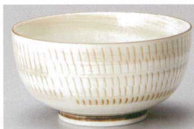
62402-511 瀏鏝飛びカンナ多用丼 970円 (16×8.4cm)