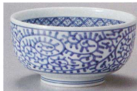
62405-621 タコ唐草大丼 960円 (15.5×8cm)