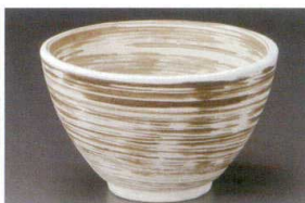
62414-33-611 至福(白)手捨姫丼 900円 (13.2×8.2cm)