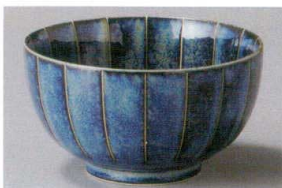
62403-161 十草(窯変紺)多用碗 970円 (13.2×7.5cm)