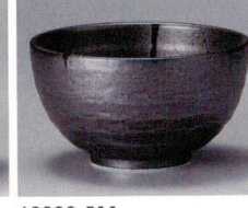
63328-511 南蛮吹流し4.0丼 840円 (12.2×7.1cm)