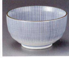
63305-161 千段十草4.1多用丼 920円 (12.8×7cm)