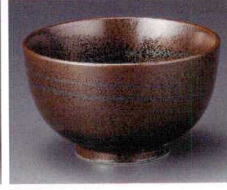
63309-161 錆ウス4.0丼 920円 (12.7×7.6cm)