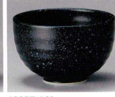
63327-641 黒銀いっぶく碗 850円 (10.5×6.6cm)