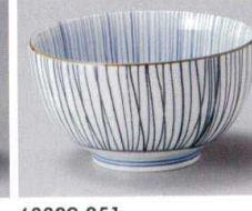
63329-251 細十草お好み丼 小 840円 (13.2×7.4cm)