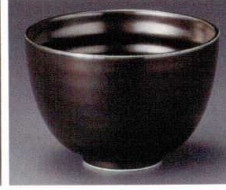
63312-181 黒釉多用小丼 980円 (12×8.3cm)