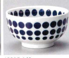
63315-641 ラウンドお好み丼 900円 (13×7cm・500cc)