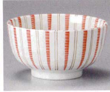
63303-601 千段十草赤4.0丼 940円 (12.8×7cm)