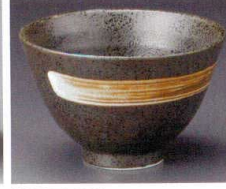
63317-121 白刷毛天目茶漬碗 880円 (12.8×8.8cm)