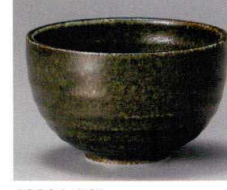
63326-641 霰変織部いっぶく碗 850円 (10.5×6.5cm)