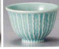
63322-161 トルコ青磁しのぎ飯碗 870円 (11.5×7.7cm)