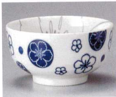
63301-601 ボビース青4.0多用丼 940円 (12.8×7cm)