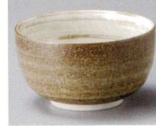
63321-051 旋風(黒)多用碗(小) 880円 (13×7.2cm)