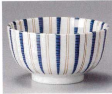
63302-601 千段十草青4.0丼 940円 (12.8×7cm)