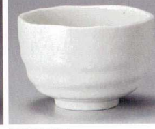
63318-511 淡雪京小丼 880円 (10.8×7.2cm)