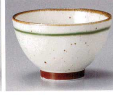
63314-471 わさび飯碗 900円 (11.6×7cm)