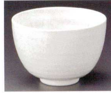
63311-181 白釉多用小丼 980円 (12×8.3cm)