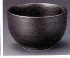
63310-101 利休天目4.0丼 950円 (13×8.2cm)