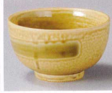
63304-281 イラボ織部夏目4.0丼 930円 (13×7.7cm)