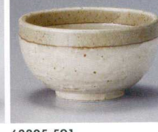
63325-591 白露4.2丼 850円 (13×7.5cm)