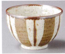
63306-181 錆十草茶漬丼 1,000円 (12×8cm)