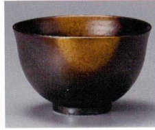
63307-511 金茶吹タマリ碗 1,050円 (13×8cm)