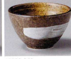
63323-241 羽衣手捻り姫丼 860円 (13.1×8.1cm)