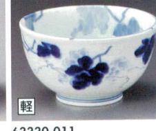
63330-011 藍染ぶどう4.5軽量丼 840円 (13.1×7.5cm)