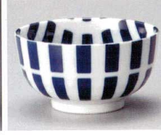
63313-641 リピートお好み丼 900円 (13×7cm・500cc)