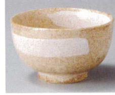
63316-281 茶粉引刷毛夏目4.0丼 880円 (12.8×7.7cm)