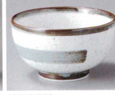
63319-281 雪見刷毛夏目4.0丼 880円 (13×7.7cm)