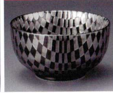
63308-161 市松 黒4.1多用丼 920円 (12.8×7cm)