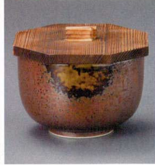
63927-331 伊賀織部飯器(木蓋付) 1,200円 (10.8×7.5cm)