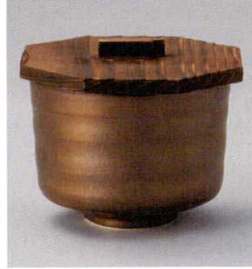
63930-401 窯変玉虫飯器 1,200円 (10.5×8.1cm)