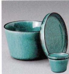
63921-081 kasaneトルコ軸飯器 1,650円 (12×8.3cm)