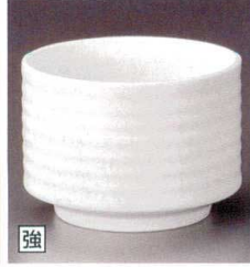
63937-291 白磁筒型飯器(小) 2,500円 (10.3×7.4cm)