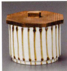
63901-051 十草飯器(蓋付) 1,980円 (10.5×8cm)