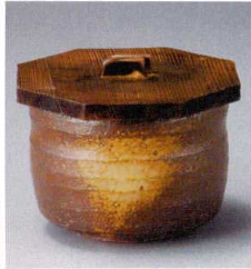
63907-181 華備前(土物)玉粥飯器(身) 1,900円 (11×8cm)