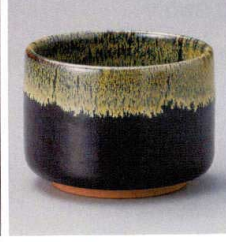
63941-491 柚子天目飯器(身) 1,680円 (10.5×8cm)