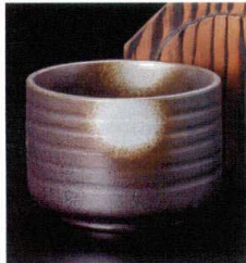
63917-511 備前白吹き蓋付飯器 1,760円 (12.3×11.4×9cm)