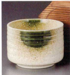
63915-511 粉引グリーン吹蓋付飯器 1,760円 (12.3×11.4×9cm)