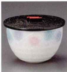
63911-181 淡雪三色吹飯器(身のみ) 1,800円 (11×8cm)