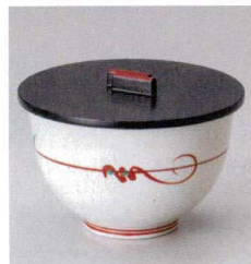
63909-121 粉引錦若芽飯器(身) 1,500円 (11.5×7.8cm)