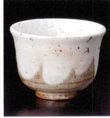
63933-461 手造御本手口反飯器 3,000円 (12.5×8.5cm)