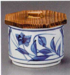
63902-051 間取桔梗飯器(蓋付) 1,980円 (10.5×8cm)