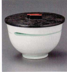
63925-121 グリーン文字粉引アイス井 1,200円 (11.5×7.8cm)