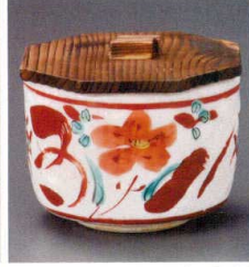
63934-451 志野赤絵飯器(蓋付) 3,550円 (11×8cm)