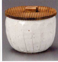
63938-451 粉引鉄彩飯器(蓋付) 3,250円 (9.5×7.5cm)