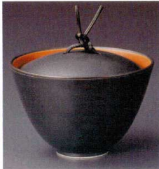
63903-511 柿釉蓋付飯器 1,930円 (11.3×8.6cm)