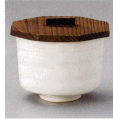
63928-401 白釉口錆飯器 1,200円 (10.5×8.1cm)