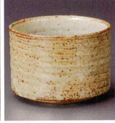
63940-461 石焼かいらぎ飯器 1,820円 (10.5×6cm)