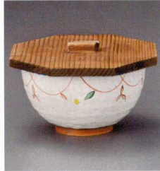
63923-181 赤絵小花飯器身 1,350円 (12.6×7.2cm)