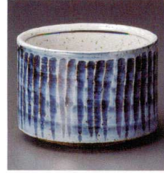
63936-461 石焼ごす巻飯器 2,600円 (11×7.5cm)