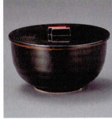
63932-221 天目多用鉢(P蓋付) 1,020円 (13×7cm)