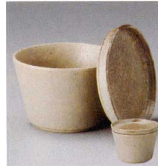
63919-081 kasaneそば軸飯器 1,650円 (12×8.3cm)