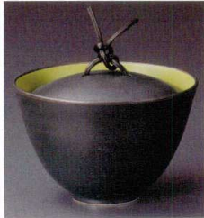
63905-511 ヒワ釉蓋付飯器 1,930円 (11.3×8.5cm)