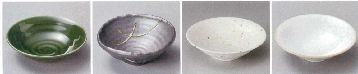
06418-641 さざ波織部向付 900円 (16.5×4.5cm) 06419-181 黒釉白流し5.0ケズリ鉢 900円 (15×15×6cm) 06420-081 白いらぼ5.5平鉢 890円 (18×5cm) 06421-491 桜流し5.5平鉢 880円 (17.5×5cm)