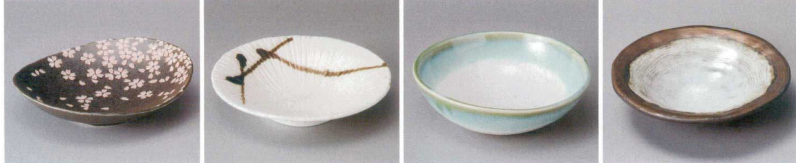
06401-121 染付桜楕円皿(大) 1,100円 (17.5×15.2×4cm) 06402-221 金色流し彫十草型多用鉢 1,100円 (20×4cm) 06403-321 淡緑彩たまご鉢 1,080円 (13.9×12.7×4.3cm) 06404-181 窯変金彩5.5浅鉢 1,080円 (17×4cm)