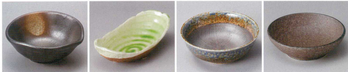
06405-161 黒備前片口小鉢 1,060円 (13.4×12.1×5.4cm) 06406-301 ヒワ寒入舟小付 650円 (13×7×3.5cm) 06407-301 ヒワ寒入舟盛鉢 1,000円 (19.5×8.5×5.5cm) 06408-241 民芸藍流し5.5中鉢 1,000円 (16.6×5.8cm) 06409-051 アース5.0ボール(黒) 980円 (16.5×5cm)