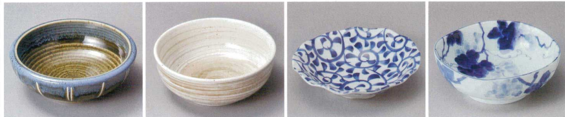
06414-011 南蛮流し5.5深鉢 930円 (17×5.5cm) 06415-011 立春粉引六兵衛5.0鉢 920円 (15.3×5.7cm) 06416-461 たご唐草波型楕円5.0平鉢 910円 (17×15×4.5cm) 06417-011 藍染ぶどう5.5三角鉢 900円 (16.7×6.2cm)