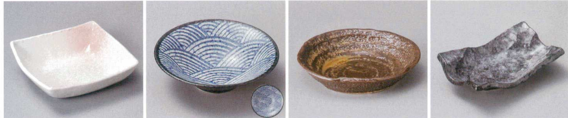
06410-301 桜吹ピンク5.0井正角 980円 (15×15×4cm) 06411-631 青海波5.0平鉢 980円 (16×4.5cm) 06412-181 伊賀釉5.0浅鉢 980円 (15.2×3.2cm) 06413-541 白雪波取皿 1,200円 (19×12×5.3cm)