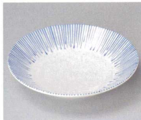
66609-051 しずく十草23cm深皿 1,250円 (23.3×5cm)