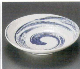
66618-611 粉引清流7.5麵皿 1,000円 (22.8×5cm)