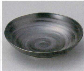
66607-201 銀彩天目麵皿 1,200円 (21×5.2cm)