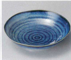
66608-201 藍白霧麵皿 1,200円 (21×5.2cm)