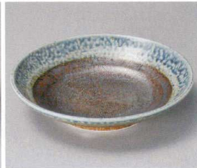
66612-241 民芸藍流し玉濁7.5麵皿 1,100円 (23×5.2cm)