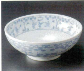
66601-541 唐人めん鉢 1,600円 (21.5×8cm)