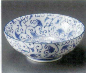
66602-541 藍彩盛鉢 1,600円 (21.5×8cm)