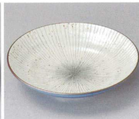
66615-241 クリーム十草玉濁7.5麵皿 1,050円 (23×5.2cm)