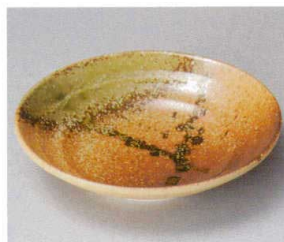
66613-241 信楽織部玉濁7.5麵皿 1,050円 (23×5.2cm)