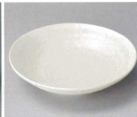
66620-081 いこい7.0寸盛皿 990円 (22×5.4cm)