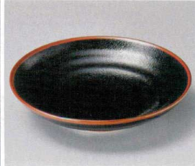
66604-241 ゆず天目玉濁7.5麵皿 1,200円 (23×5.2cm)