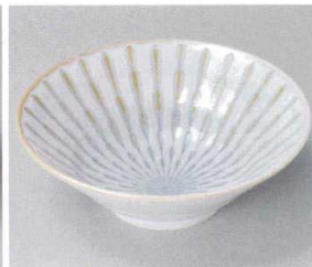
66616-161 フォーカス藤輪二重6.5深鉢 1,010円 (20×6.8cm)