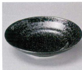
66617-241 銀彩黒玉濁7.5麵皿 1,000円 (23×5.2cm)