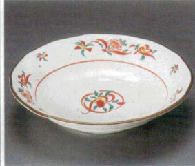
66603-161 赤絵花7.0めん皿 1,240円 (21×4.3cm)