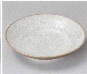
66611-301 郷巻きかいらぎミツフ7.5麵皿 1,100円 (23×5cm)