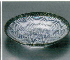
66619-611 青海波7.5麵皿 1,000円 (22.8×5cm)