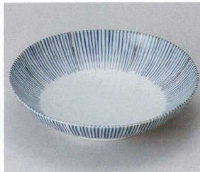
66606-201 十草麵皿 1,200円 (21×5.2cm)