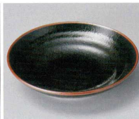
66614-011 ゆず天目7.5ミツフ麵皿 1,050円 (23×5cm)