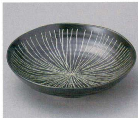
66605-201 黒そぎ麵皿 1,200円 (21×5.2cm)