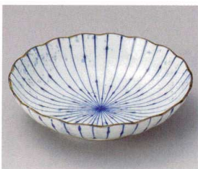
66714-361 吹墨十草6.8深皿 850円 (21×5.5cm)