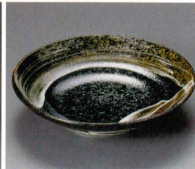
66703-611 明世荒刷毛7.5麺皿 980円 (22.8×5cm)