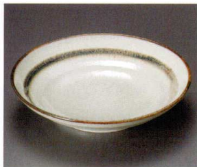
66705-021 うのふ7.5麺皿 950円 (22.7×5cm)