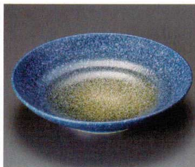
66706-641 星屑7.5めん皿 1,000円 (22.8×5cm)