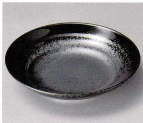
66710-011 黒真珠7.5ミツツ麺皿 1,000円 (23×5cm)