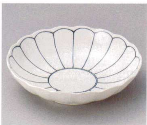
66713-361 菊紋6.8深皿 850円 (21×5.5cm)