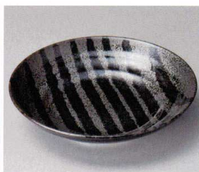
66715-011 流彩ライン黒7.5ミツツ麺皿 1,000円 (23×5cm)