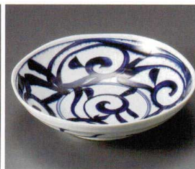
66707-491 藍草紋6.8深皿 880円 (21×5.7cm)