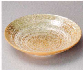
66701-051 刷毛目織部7.5麺皿 980円 (22.5×5cm)