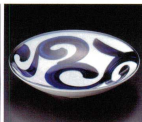
66720-511 鳴門唐草麺皿 680円 (21×5cm)