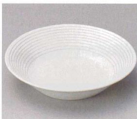
66719-361 シルキーライン7.0深皿 800円 (21.2×5cm)