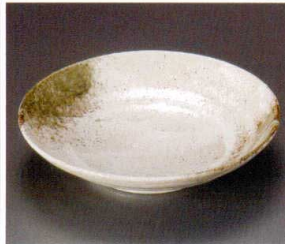
66702-611 雪志野7.5麺皿 980円 (22.8×5cm)