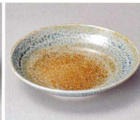
66712-011 砂地藍流し7.5ミツツ麺皿 1,000円 (23×5cm)