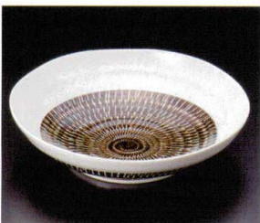
66718-511 鑄飛びカンナ麺皿 840円 (21×5.2cm)