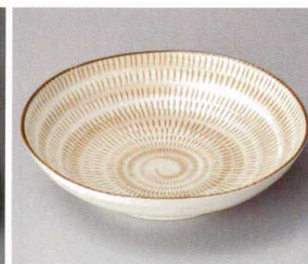
66708-20・491 萩かな麺皿 880円 (21×5.2cm)