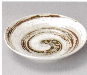
66711-011 鳴門7.5ミツツ麺皿 1,000円 (23×5cm)