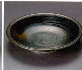
66704-641 新月円7.5盛皿 1,000円 (23×4cm)