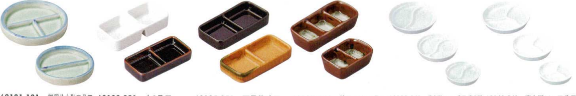
68131-131 御深井丸型三品皿 730円 (10×1.7cm) 68133-291 白2品皿 1,050円 (14.5×7×3.3cm) 68135-251 天目薬味皿 750円 (10.7×5.5×2cm) 68137-151 錆おふけニ3品皿 740円 (9.4×4.5×2.1cm) 68138-151 錆おふけニ2品皿 580円 (6.3×4.5×2.1cm) 68139-541 青白磁14cm二分皿 520円 (14×2.2cm) 68140-541 青白磁12cm二分皿 500円 (12×2.1cm) 68141-541 青白磁10cm二分皿 460円 (10.2×2cm) 68142-541 青白磁14cm三分皿 520円 (14×2.2cm) 68143-541 青白磁12cm三分皿 500円 (12×2.1cm) 68144-541 青白磁10cm三分皿 460円 (10.2×2cm)