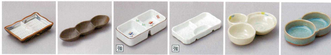
68101-181 天目金芦(土物)ニツ切やくみ皿 2,300円 (12.8×8×2.6cm) 68102-461 備前風 三つ仕切皿(小) 2,200円 (24×5.5×3.5cm) 68103-131 赤絵小花二品盛 1,990円 (14.5×7×3.4cm) 68104-151 青白磁多用三品皿 1,500円 (16.6×8.8×2.4cm) 68105-151 三彩三品皿 1,100円 (16.6×13×3.6cm) 68106-151 亀甲青磁二品ヤクミ皿 1,200円 (15×8.8×3.3cm)