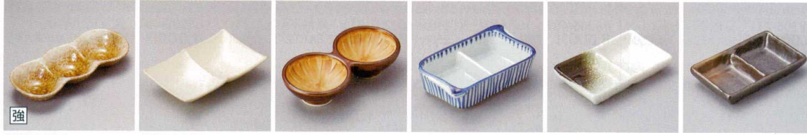
68113-061 黄彩三仕切鉢 1,470円 (21.6×9.3×3.3cm) 68114-201 白練り粉引仕切皿 1,250円 (14.3×8.5×3cm) 68115-311 スリ鉢二品 1,180円 (17×8.5×3.8cm) 68116-151 十草深口二品皿 1,050円 (14×8×4cm) 68117-051 白石目二品皿 1,050円 (13×8×2.3cm) 68118-051 黒石目二品皿 1,050円 (13×8×2.3cm)