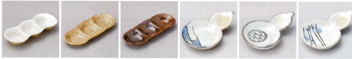
68107-321 白吹雪珍味三つ仕切皿 1,450円 (21.6×9.2×3.4cm) 68108-281 窯変令和イラボ三品盛 1,300円 (18×7.5×2cm) 68109-281 窯変令和天目三品盛 1,300円 (18×7.5×2cm) 68110-461 古染市松瓢型薬味皿 1,250円 (13×9.5×3cm) 68111-461 古染七宝丸紋瓢型薬味皿 1,250円 (13×9.5×3cm) 68112-461 古染渦水玉瓢型薬味皿 1,250円 (13×9.5×3cm)