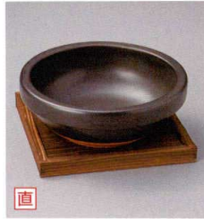
直 69901-711 ビビンバ鍋(黒) 3,800円 (20.5×7.5cm・1100cc) 69902-711 19cm枠付敷台 1,400円 (19×19×2cm)