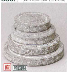
直 韓国製 69941-641 丸ステーキ石10cm 2,500円 (16×2cm) 69942-641 丸ステーキ石12cm 2,900円 (12×2cm) 69943-641 丸ステーキ石14cm 3,000円 (14×2.5cm) 69944-641 丸ステーキ石16cm 3,400円 (16×1.5cm)