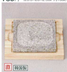
直 韓国製 69939-641 16cm正角プレート 6,500円 (16×16×2cm) 69940-641 20cm角木台(小) 3,300円 (22×20×2.1cm・内寸17×17cm)