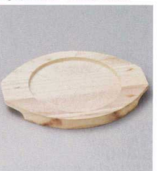
69936-641 平木台(小) 2,100円 (19.6×14.5×2cm・内10.6cm) 69937-641 平木台(中)(12~16用) 2,350円 (20×15.8×2cm・内12.5cm) 69938-641 平木台(大)(18~20用) 2,650円 (24×19×2cm・内15.1cm)