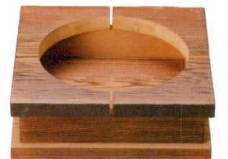
69954-711 京雅釜台 10,000円 (23.5×23.5×8.3cm・内寸18.2cm)