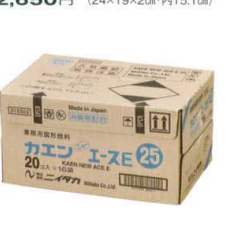
69947-481 ニューエース25g 14,000円 (25g×320入) 69948-481 ニューエース30g 14,000円 (30g×280入)