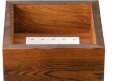
69955-711 升型釜台(断熱ボード付) 11,000円 (22×22×9.5cm・内寸角18.2cm)