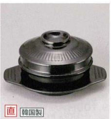
直 韓国製 69930-641 チゲ鍋14cm身丈 1,850円 (14×7.4cm・770cc) 69931-641 チゲ鍋14cm蓋付 2,810円 (14×11cm) 69932-641 メラミン敷14cm用 540円 (21.2×17×2.5cm・内11.5cm)