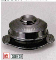
直 韓国製 69927-641 チゲ鍋16cm身丈 2,300円 (15.8×8cm・1000cc) 69928-641 チゲ鍋16cm蓋付 3,600円 (15.8×12cm) 69929-641 メラミン敷16cm用 680円 (23×19×2.5cm・内12.5cm)