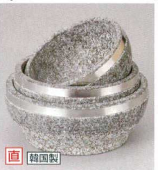
直 韓国製 69917-641 14cmステン巻石鍋 6,800円 (14×7.5cm) 69918-641 16cmステン巻石鍋 7,500円 (16×7.5cm) 69919-641 18cmステン巻石鍋 8,300円 (18×7.5cm)