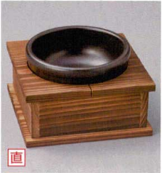
直 69905-711 びびこ黒(ビビンバ用) 3,300円 (15×6.5cm・600cc) 69906-711 がんじょう釜台(小) 4,200円 (17.5×17.5×8cm)