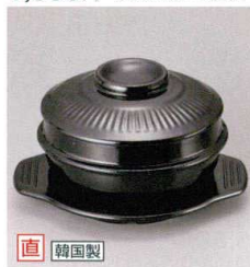
直 韓国製 69924-641 チゲ鍋18cm身丈 2,700円 (17.5×9cm・1400cc) 69925-641 チゲ鍋18cm蓋付 4,100円 (17.5×14cm) 69926-641 メラミン敷18cm用 760円 (23.5×20×2.5cm・内13cm)