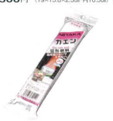
69946-481 5個入カエン30g 500円 (30g×5入)