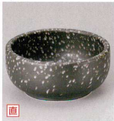
直 69913-471 石目ビビンバ(小) 2,300円 (15.3×7.6cm) 69914-471 石目ビビンバ(中) 2,600円 (16.5×7.9cm) 69915-471 石目ビビンバ(大) 2,900円 (18×8.3cm)