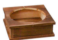
69952-711 がんじょう釜台(大) 4,500円 (20×20×7cm)