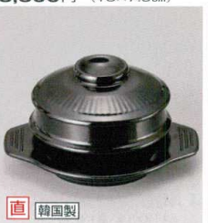
直 韓国製 69933-641 チゲ鍋12cm身丈 1,650円 (12×7cm・500cc) 69934-641 チゲ鍋12cm蓋付 2,500円 (12×10cm) 69935-641 メラミン敷(12cm用) 500円 (19×15.8×2.5cm・内10.5cm)