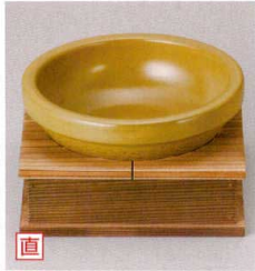
直 69903-711 ビビンバ鍋(茶) 3,800円 (20.5×7.5cm・1100cc) 69904-711 がんじょう釜台(大) 4,500円 (20×20×7cm)