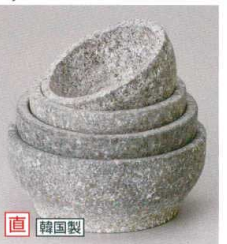
直 韓国製 69920-641 石鍋12cm 5,600円 (12×6.5cm) 69921-641 石鍋14cm 6,000円 (14×7.5cm) 69922-641 石鍋16cm 6,600円 (16×7.5cm) 69923-641 石鍋18cm 7,300円 (18×7.5cm)