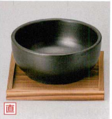
直 69907-711 深型ビビンバ鍋(大黒) 4,500円 (18×8cm・1100cc) 69908-711 枠付敷板19cm 1,400円 (19×19×2cm)