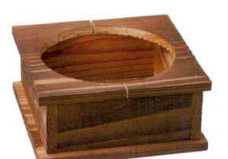
69953-711 がんじょう釜台(小) 4,200円 (17.5×17.5×8cm)