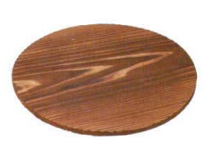
69949-711 丸型敷台14cm 750円 (14cm) 69950-711 丸型敷台19.5cm 1,350円 (19.5cm) 69951-711 丸型敷台25.5cm 1,900円 (25.5cm)