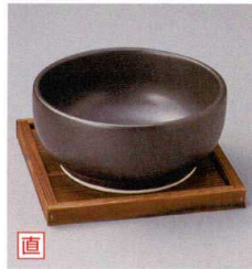
直 69911-481 黒ビビンバ(一人用) 4,500円 (17.8×8cm) 69912-481 18cm枠付敷台 1,350円 (18×18×2cm)