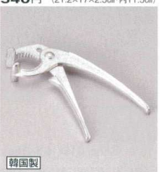
韓国製 69945-641 石鍋つかみホルダー 900円 (18cm)