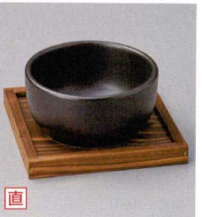
直 69909-48-711 黒ビビンバ(ミニ) 2,700円 (13.7×6.7cm) 69910-48-711 16cm枠付敷台 1,100円 (16×16×2cm)