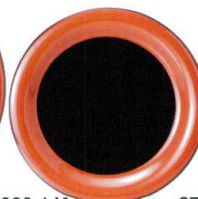
97328-641 7 1/2吋皿 1,800円 (19.2×2.3cm)