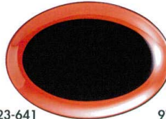
97323-641 9吋プラター 2,700円 (23.2×16.6×2.5cm)