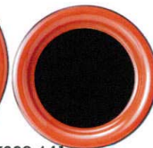
97329-641 6 1/2吋皿 1,400円 (16×1.9cm)