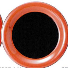
97327-641 9吋皿 2,200円 (23×2.6cm)