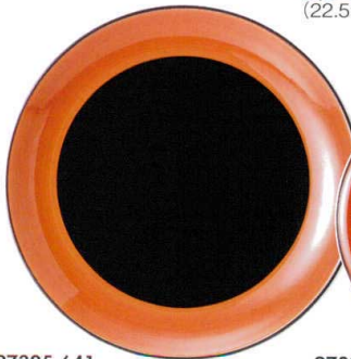
97325-641 12吋皿 5,900円 (32×3.8cm)