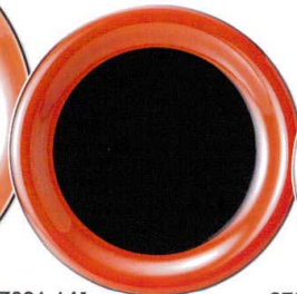
97326-641 10吋皿 3,000円 (26×2.9cm)