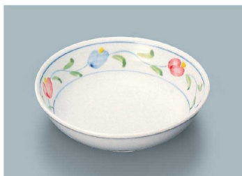
KS-845 AZ(あじわい) 深菜皿