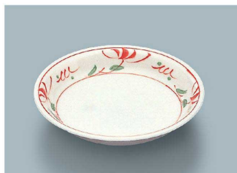
YS-3 AE(赤絵) 菜皿