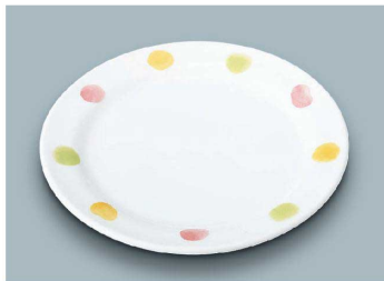
YS-372 CAN(キャンディ) パン皿