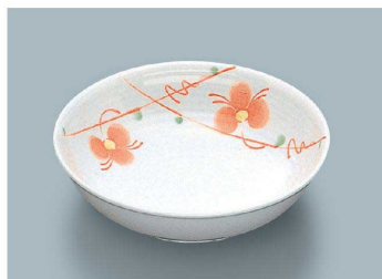
KS-845 HH(初花) 深菜皿