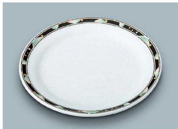
YS-372 PLA(プラネット) パン皿