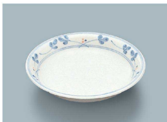
YS-3 HG(萩) 菜皿