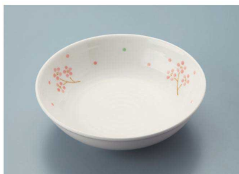
KS-845 RIO(里桜) 深菜皿