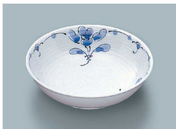
KS-845 SEI(青風) 深菜皿