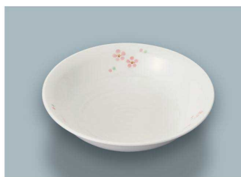
KS-885 RIO(里桜) 深皿