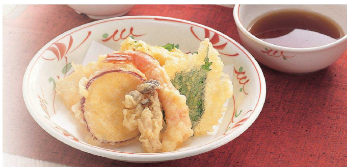
使用食器 | YS-3 AE 菜皿、YB-19 AE 小鉢