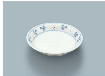
YS-1 HG (萩) 小皿 107 × 21 (5/100) ¥950