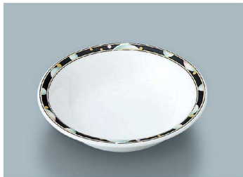
YS-371 PLA (プラネット) フルーツ皿 140 × 33 (6/72) ¥1,540 C-140 ¥390 → P.303