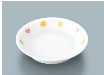
YS-371 CAN (キャンディ) フルーツ皿 140 × 33 (6/72) ¥1,480 C-140 ¥390 → P.303