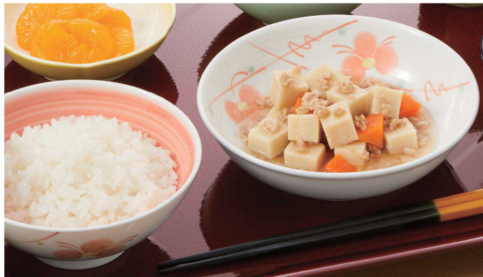
使用食器 | KB-828 HHO 飯碗、KS-845 HH 深菜皿、TH-220S KTK PBT塗り箸