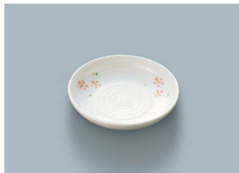
KS-844 RIO (里桜) 小皿 97 × 20 (10/200) ¥870