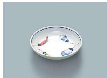
KS-844 YSA (野菜) 小皿 97 × 20 (10/200) ¥950