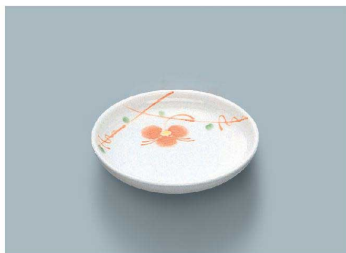
KS-844 HH (初花) 小皿 97 × 20 (10/200) ¥870