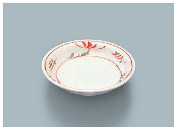
YS-1 AE (赤絵) 小皿 107 × 21 (5/100) ¥960