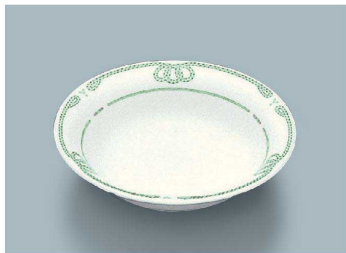
YS-3017 VL (ヴェールライン) ペリー皿 140 × 34 ・ 220ml(6/72) ¥1,350 C-140 ¥390 → P.303