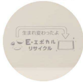
新受 RET-10 IV 長方形 370×270×18 (印字を入れた場合のイメージです。)