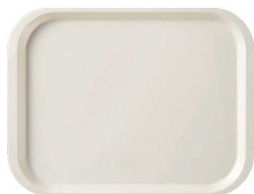
新受 RET-52 IV 長方形 355×270×18