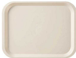
新受 RET-56 IV 長方形 380×290×19