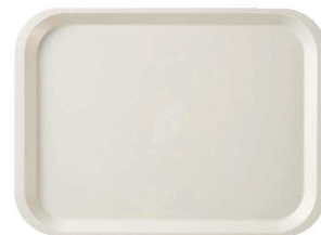
新受 RET-21 IV 長方形 415×303×19