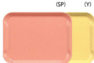
受 RT-104 長方形 350×260×19 ¥1,150