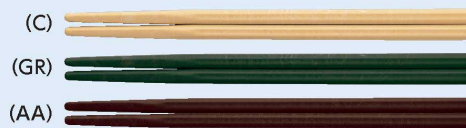
受AH-185X はし 185mm ¥290

受マークは受注生産品ですが、在庫の用意がある場合があります。最寄りの営業所にお問い合わせください。