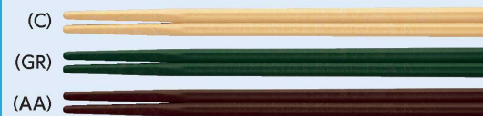
受AH-205X はし 205mm ¥300