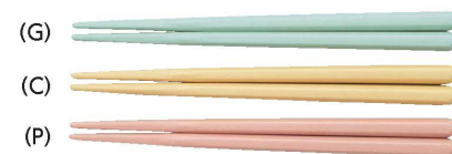
AH-160S はし 160mm ¥280