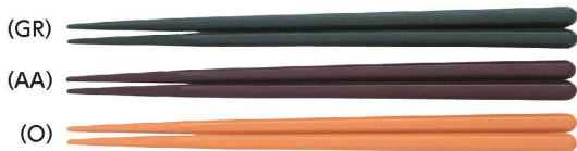
AH-210S はし 210mm ¥310