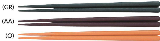
AH-220S はし 220mm ¥310