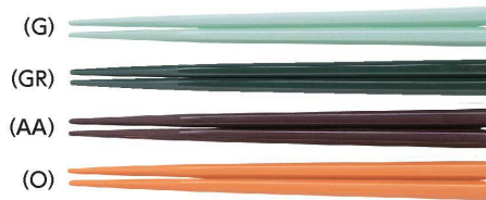
AH-180S はし 180mm ¥290