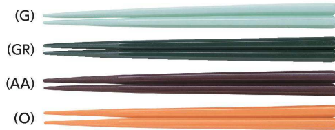
AH-195S はし 195mm ¥300