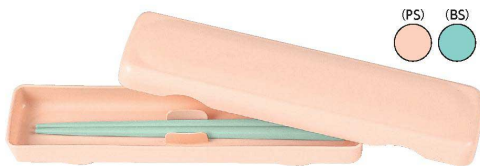
BX-1 はし箱(仕切りあり) 225×57×25 ¥550